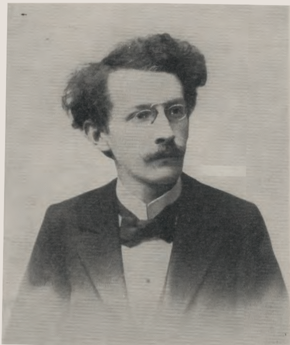
Zdeněk Nejedlý – na fotografii ještě jako mladý revolucionář

Do 31. prosince 1949 vydalo SNDK šest děl českých klasiků (Erben, dvakrát Neruda, S. K. Neumann, Tyl, Fučík), pět prací původních (Hostáň, Vaňátko, dvakrát Sekora a Krejčová), šest překladů ze sovětské literatury a dva sborníky poezie a prózy My světa dobudeme a Vpřed . První vizitkou podniku byl Sekorův „veselý výbor nejpěknějších říkadel z Erbenovy sbírky lidové tvorby“ Říkej si a hraj s ilustracemi Aleny Ladové. Měl ediční číslo 1, byl tedy první knihou nově vzniklého nakladatelství, které se stalo nepominutelnou součástí české knižní scény. V roce 1969 nakladatelství změnilo název SNDK na poetičtější Albatros .