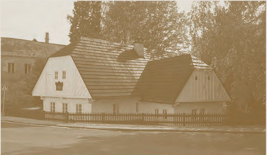
Rodný dům Aloise Jiráka