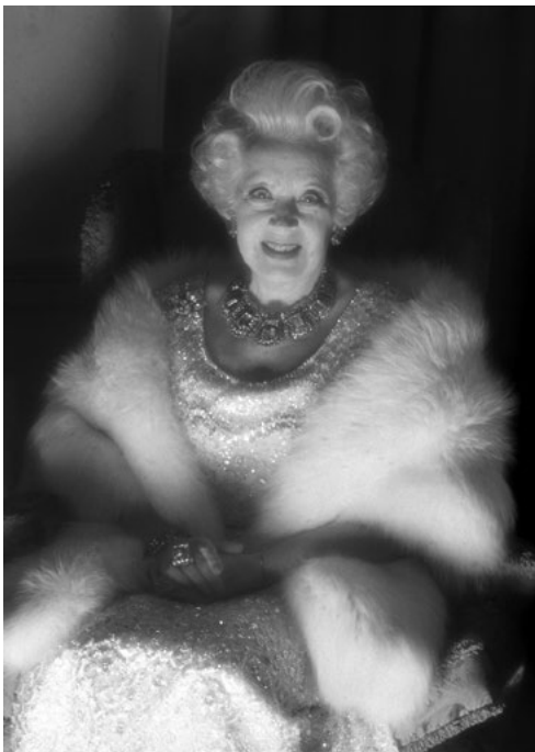
Barbara Hamilton Cartlandová

It sounded like a typical fairy tale but the happy ending was nowhere in sight. When Diana's grandfather died and her father became Earl of Spencer, he married Barbara Cartland's daughter. The stepmother Raine had her husband under the control and never forgot to mention that Diana was so stupid she could not even finish her studies.