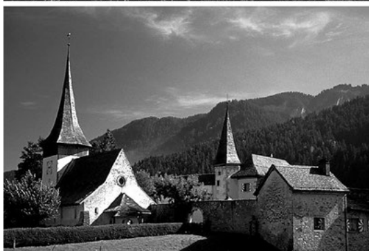
Švýcarské město Rougemont, kde byl Institut Alpin Videmanette