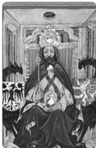
Karel IV. jako český král a římský císař po sobě zanechal dvě závěti, jimiž rozdrobil lucemburské panství v Českém království i v německé říši mezi své potomky a příbuzné.

Bohužel, králevicova matka a třetí císařova manželka Anna Svídnická se této korunovace nedočkala. Zemřela v roce 1362, necelého půldruhého roku po Václavově narození.