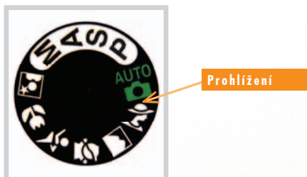
Obrázek 3: Přepínač režimů.