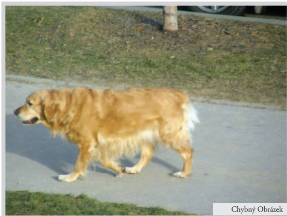
Obrázek 6 CH: Pes brzy narazí na hranu obrazu, přestože má za sebou a nad sebou zbytečný prostor. Horní okraj chodníku se dotýká jeho břbetu.