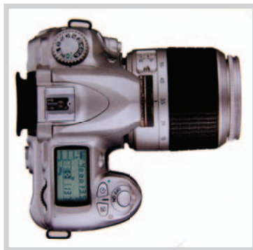
Obrázek 10: U jednooké digitální zrcadlovky se dá nastavit úplně všechno jako u klasického i digitálního fotoaparátu dobromady, a to i video.

Pohled přes hledáček nebo na displej je i pohledem přes objektiv, neboť vidíme to, co fotíme. Jsou konstruované jako klasická zrcadlovka. Za zrcátkem se však nenachází film, ale CCD čip. Zrcátko se při expozici sklopí nahoru k matnici a po ní se vrací zpět do dřívější polohy. Nevýhodou zrcadlovek jsou jejich větší rozměry a nutnost vyměňovat objektivy.