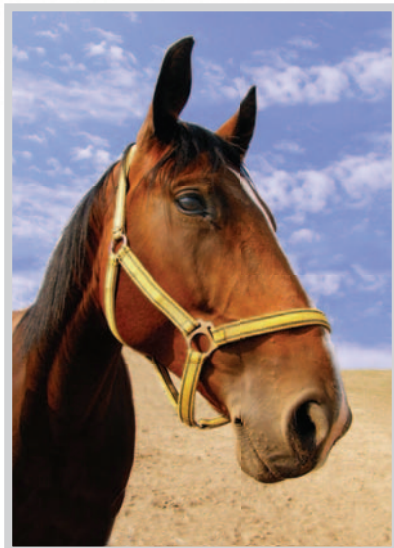
Obrázek 7: Na digitální aparát se můžeme spolehnout. Stačí vybrat vhodný záběr.