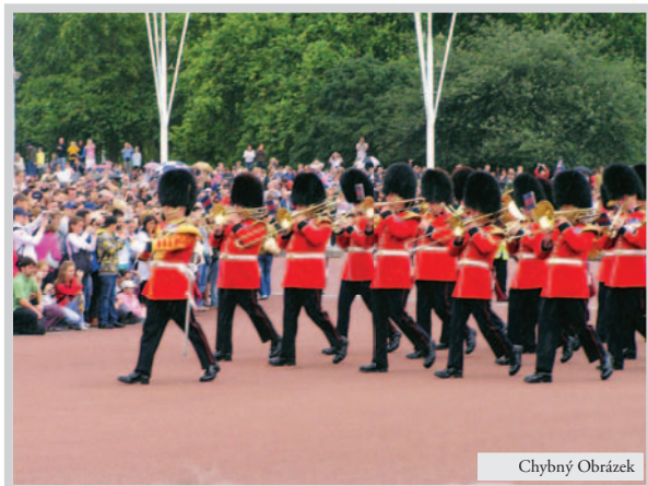
Obrázek 5 CH: Nahoře a dole je zbytečný prostor, ruší bílé trámy a diváci splývají s gardou.