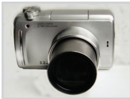
Obrázek 9: Aparát vhodný pro rodinnou fotografii včetně zoomu, makro i videa.

3. Jednooké digitální zrcadlovky mají výměnné objektivy. Vyhovují zapáleným amatérům, neboť tvoří královskou třídu digitálních fotoaparátů. Poskytují vysokou kvalitu fotografií, neboť umožňují plnou kontrolu nad fotoaparátem.