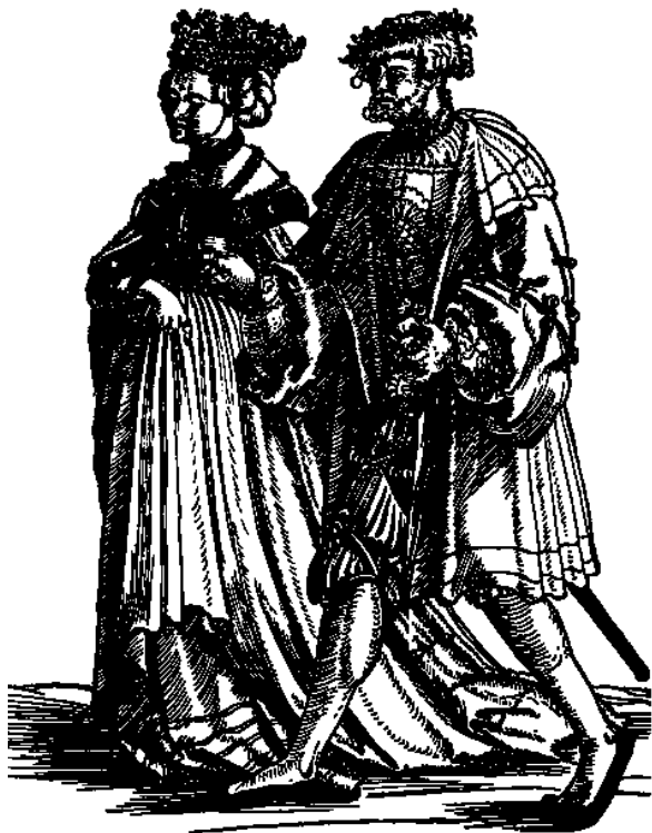
Svatební oděv šlechty kolem poloviny 16. století. Dřevořez Erharda Schöna.

vyšší politické ambice, a spříznění s Rogendorfy k výraznému posílení svého vlivu v okolí krále Ferdinanda nevyužil. Nicméně i bez Joštova přičinění důsledky sňatku začlenily Rožmberky do habsburské politické koncepce a mnohem výrazněji než dřív je spoutaly s rakouskou šlechtou. Svazky příbuzenství a švagrovství sehrávaly ve stavovské společnosti nedocenitelnou úlohu. Rozvíjely se na úrovni partnerství vysoce privilegované společenské elity a vytvářely rozvětvenou síť konexí, jež otvíraly dveře k panovníkovi i k vysokým úřadům a napomáhaly při sňemovních, administrativních a soudních jednáních. Zvyšovaly prestiž osob vstupujících do veřejného života a ve chvílích politických krizí se mohly stát rozhodující oporou jednotlivce i rodu. 17