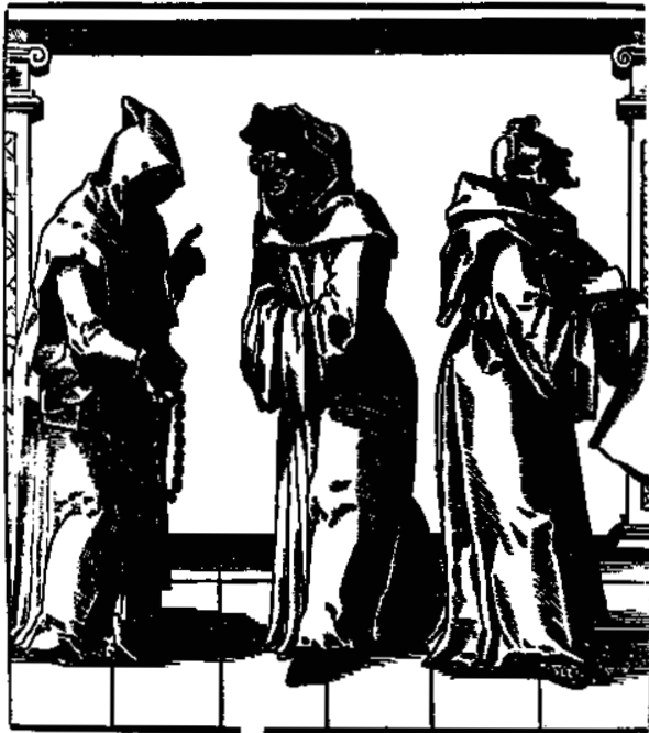
Trojice mnichů. Dřevořez Tobiasa Stimmera z druhé poloviny 16. století.

Napětí mezi kanovníky a měšťany přerůstalo v otevřené nepřátelství, jež dosáhlo vrcholu v prosinci 1670. Řeholníci ztratili poslední zábrany a využili kazatelný i chrámový zpěv k neslýchanému útoku. Slovy Starého zákona zlořečili městu a vyřkli kletbu nad jeho obyvateli. Veršem 108. žalmu Davidova – „ s Bohem statečně si povedeme, on rozšlape naše protivníky “ – dali najevo naprostou nesmiřitelnost vůči Třeboňským. Leč taková slova nezastrašila, nýbrž pobouřila. Měšťané za podpory zámeckého hejtmána a panských myslivců oblehli klášter a nepřipustili jeho zásobování potravinami. Tři augustiniáni byli zadrženi a uvězněni na zámku. Teprve zásah pražského arcibiskupa zprostředkoval příměří, ale i později vyvěrala na povrch skrytá nenávisť. Řeholníci, jejichž počet dosahoval pětadvaceti, se v Třeboni cítili jako v nepřátelském městě. Vycházeli do ulic ozbrojeni šavlemi a holemi, aby se mohli bránit útokům, a jednou také došlo k neúspěšnému atentátu na samotného probošta. 16 Snahy o úplné vymanění augustiniánské kanonie z područí světské vrchnosti i o podrobení města klášteru skončily