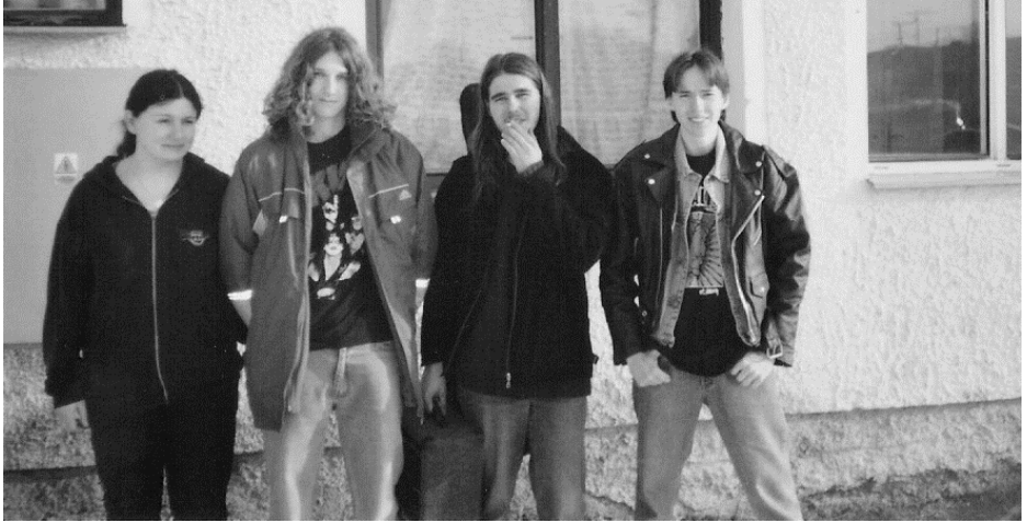
Poslední foto Dessert Eagle