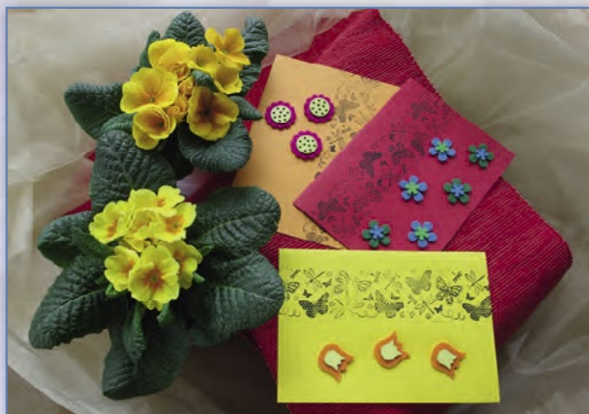
Přáníčka s plstěnými ozdobami