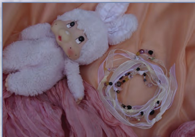
Korálky pro malou princeznu