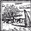
19 LONG MEG