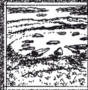
4 ARBOR LOW