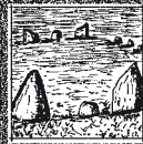
9 ROUGH TOR