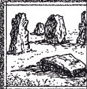
8 STANTON DREW