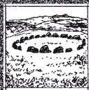
15 MOEL TY UCHAF