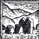
18 CASTLE RIGG