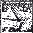
11 BOSCAWEN LIN