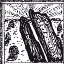
14 GORS FAWR