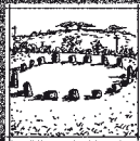
12 MERRY MAIDENS