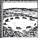
5 BAR BROCK