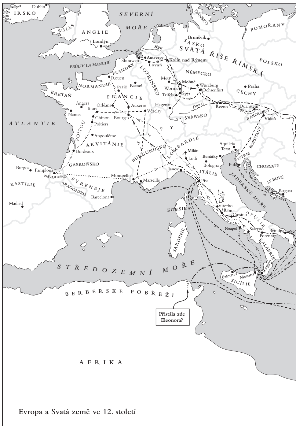
Evropa a Svatá země ve 12. století