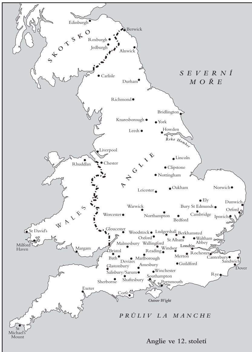
Anglie ve 12. století