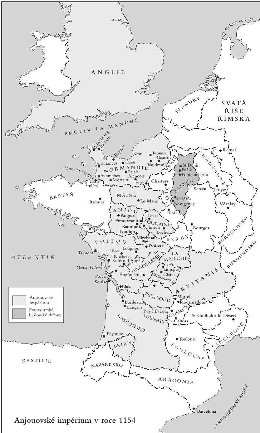
Anjouvské impérium v roce 1154