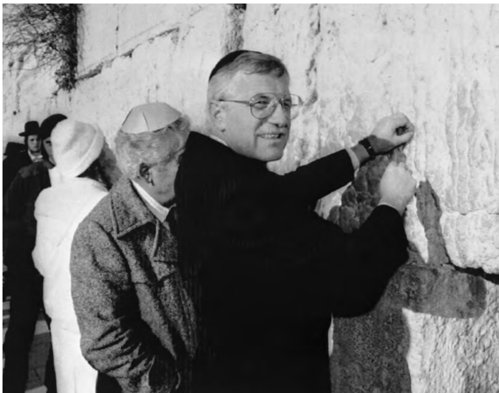
Ve středu světa s přáním u Zdi nářků.

Mám před sebou krásnou středověkou mapu světa, kterou mi věnoval starosta Jeruzaléma. Ta ukazuje svět jako trojlístek, skládající se z Evropy, Asie a Afriky a mající ve svém středu právě Jeruzalém. Dával mi ji se slovy, že se snad neurazím, že je v ní Jeruzalém považován za střed světa, když my jsme jistě přesvědčení, že si středem světa zaslouží být Praha.