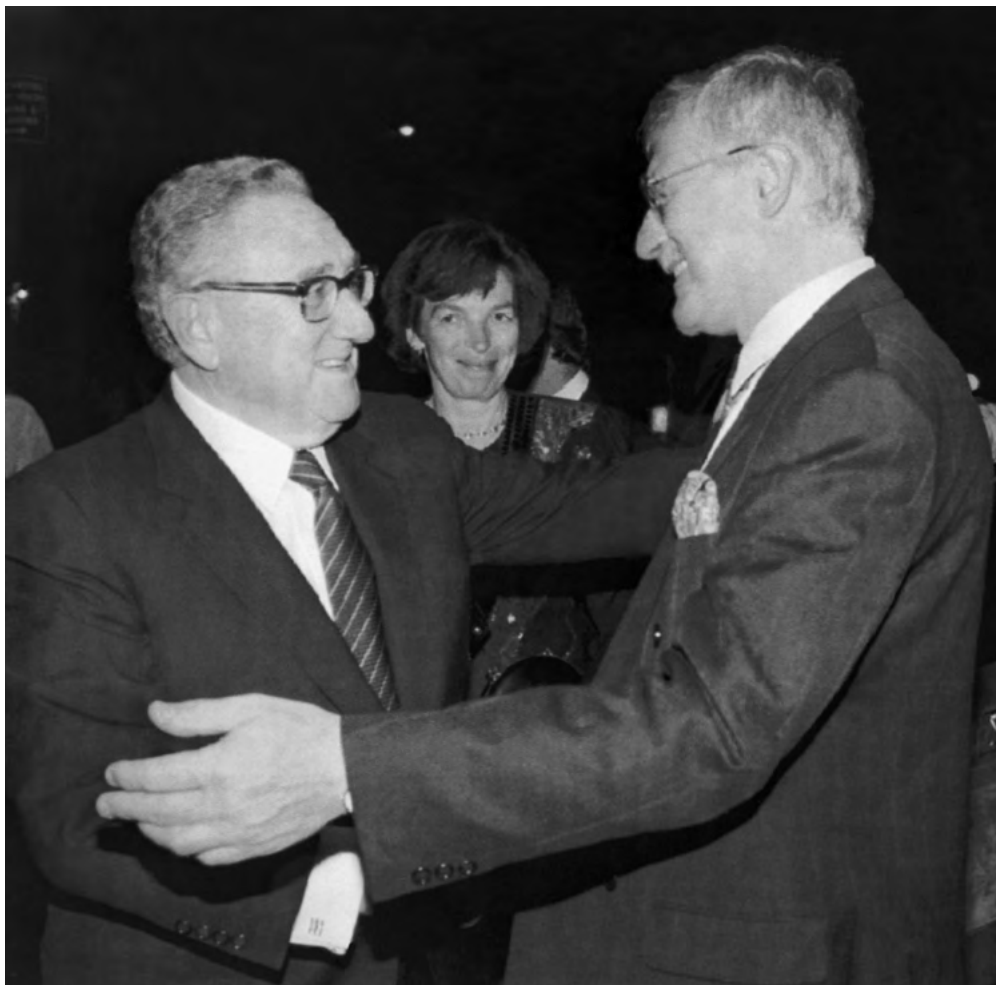
Před premiérovou cestou po jižní Americe s architektem americké zahraniční politiky Henry Kissingerem v New Yorku.