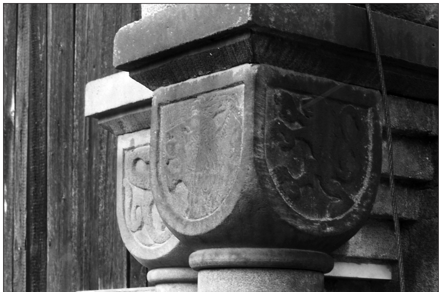
(nahore) Zdobené hlavice sloupů zbytků kaple Kajetánka – (olevo) Vstup do věžice kaple Kajetánka – (opravo) Polygonální věžice bývalé kaple Kajetánka (2008)