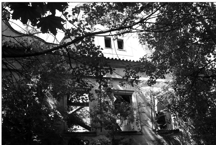
Usedlost Kajetánka v Praze-Břevnové (2008)

Největší dobrodinec theatinů, Bernard Ignác z Martinic, zemřel 7. 1. 1685 a byl pohřben v Martinické kapli katedrály sv. Víta. V souladu s jeho přáním