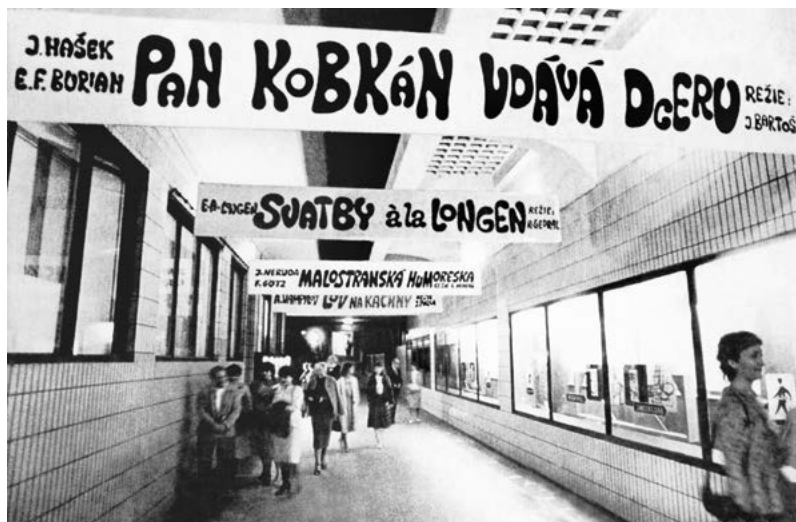
Divadelní pasáž.

Vcházelo se do něj mohutnými skleněnými dveřmi uprostřed dlouhé pasáže, za kterými byl o deset metrů dál úzký služební vchod, před nímž na fotografii postává čtveřice. Dodnes bych k němu dokázal dojít poslepu podél dřívější restaurace U Rozvařilů, dnes kavárny Starbucks, otevřít těžké dveře, projít kolem vrátnice a pánských šaten nalevo a maskérny a dámské šatny napravo ke schodům vedoucím dolů do spletitých zákulisních prostor.