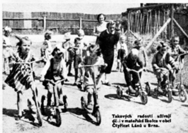
Takovýk radostí užijtej děi v mateřské školce velet Čtyřlístek Láni v Brně.

Pročpak mne, maminko, bereš s sebou, když jdu pracovat do chléva nebo na pole? Proč mne necháš hrát si na silnici nebo na dvorku? Proč mne své fuje dozoru starší sestřičce? Věš, kolik rostežáků na moje žlába ve chlévě, na poli, na silnici? Vždyť ty, která po řadu let pracuješ v zemědělství, jsi dobře pozna, jak snadno může dospělý člověk i při největší opatrnosti přijít k úrazu nebo onemocněti. Co potom já - náramně zvlášť malý člověček, který rád na všechno sáhne, všechno dá do pusy! Copak bys řekla tatínkovi, kdyby nechtěl vstít mladý kluk bez oděvu, bez pokrývky hlavy, že je špatný hospodář, víd! A já jsem také takový mladý stroemek, který potřebuje mnoho péče, mnoho opatrování a pořádný důstoj!