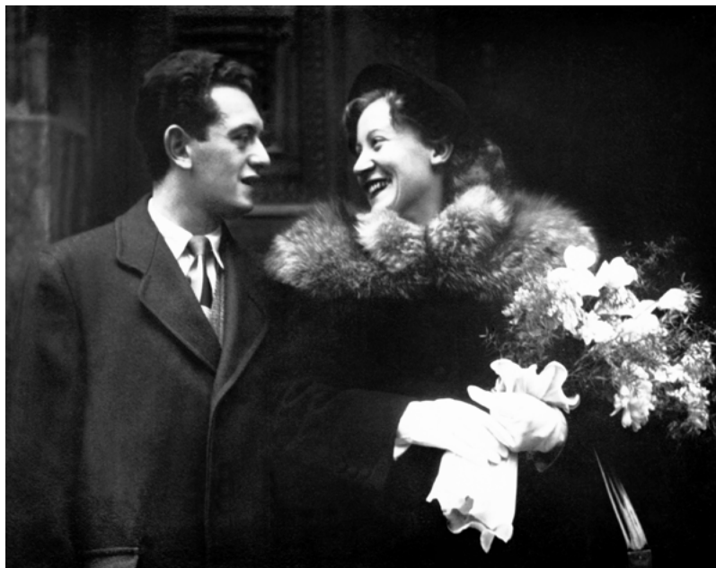
Svatební foto mých rodičů 11. listopadu 1949.