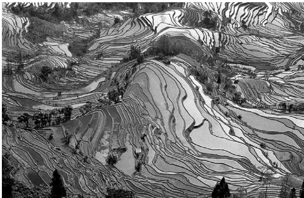
Rýžová pole v Jün-nanu

a Ming se nová technika rozšířila i do méně rozvinutých oblastí provincie An-chuej a do nížin při Žluté řece. V 17. a 18. století se tato inovace konečně prosadila také v centrální Číně, v S'-čchuanu i v hraničních oblastech jižní a jihozápadní Číny.