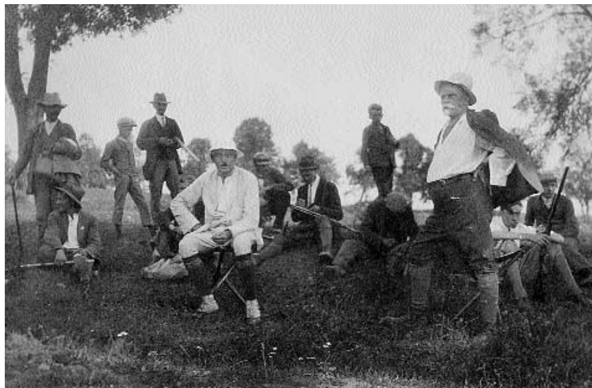
Karel Kramář na honu

„ovšem bez těch 100 zlatých“, jak později podotknul. 22 Přes všechno vynaložené úsilí se právníčině ve smyslu práce v advokátní kanceláři nebo u soudu nikdy nevěnoval. Celý život se ale účastnil tvorby zákonů, ať již v Rakousku-Uhersku nebo pak v Československu. Svého doktorského titulu si nesmírně vážil a byl na něj hrdý. O tom, jak na něm lpěl, svědčí i úsměvná historka z honu. Kramáře kdysi jeden z účastníků oslovil „pane poslanče“. Kramář ho hned zarazil se slovy, že tady, na honu, je přece mezi svými, takže tady je jen „doktor Kramář“.