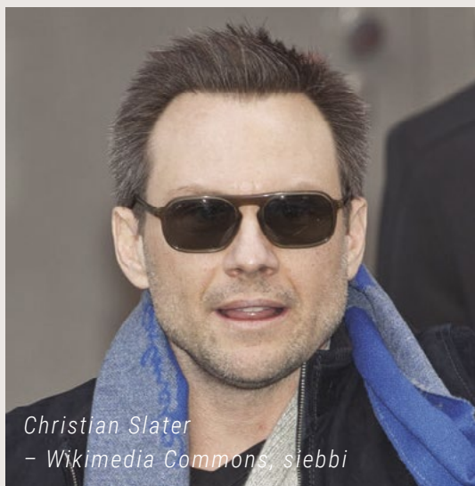
Christian Slater