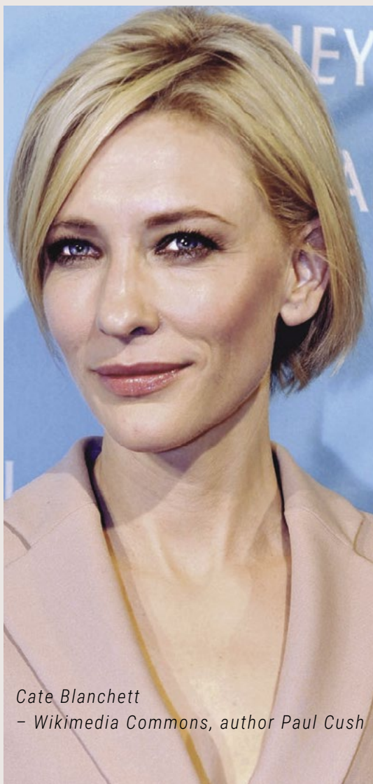
Cate Blanchett

1921: Alexander Dubček, Charles Bronson , 1945: Goldie Hawn, Steve Martin , 1957: Dolph Lundgren , 1969: Edward Norton, Cate Blanchett, Renée Zellweger , Christian Slater, Matthew McConaughey, Matthew Perry, Erika Eleniak