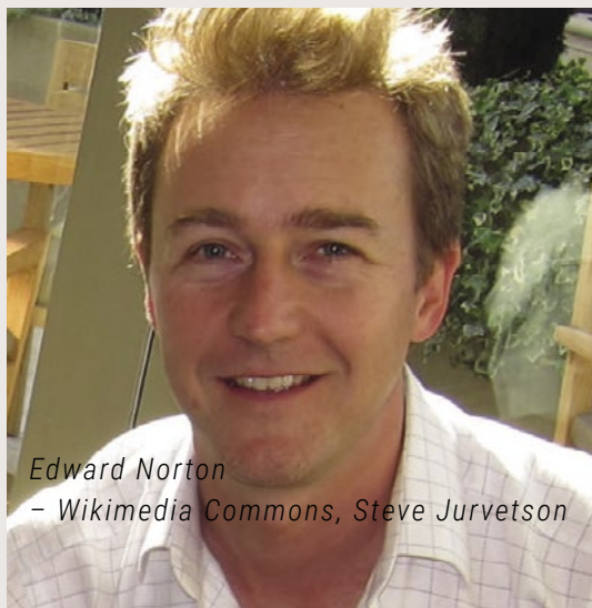
Edward Norton