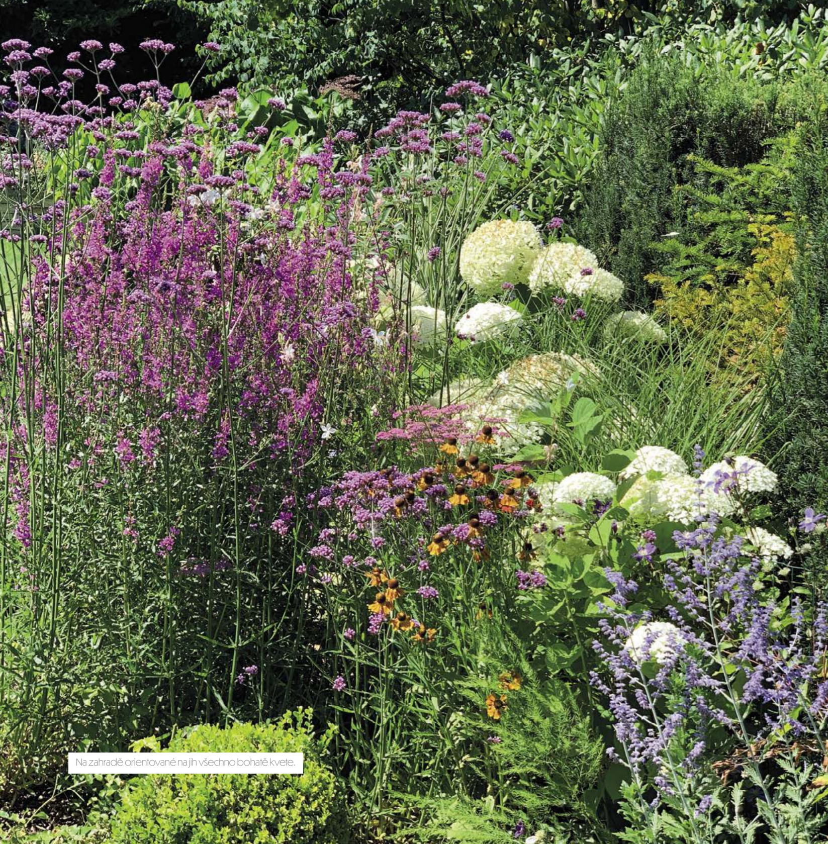
Na zahradě orientované na jih všechno bohatě kvete.