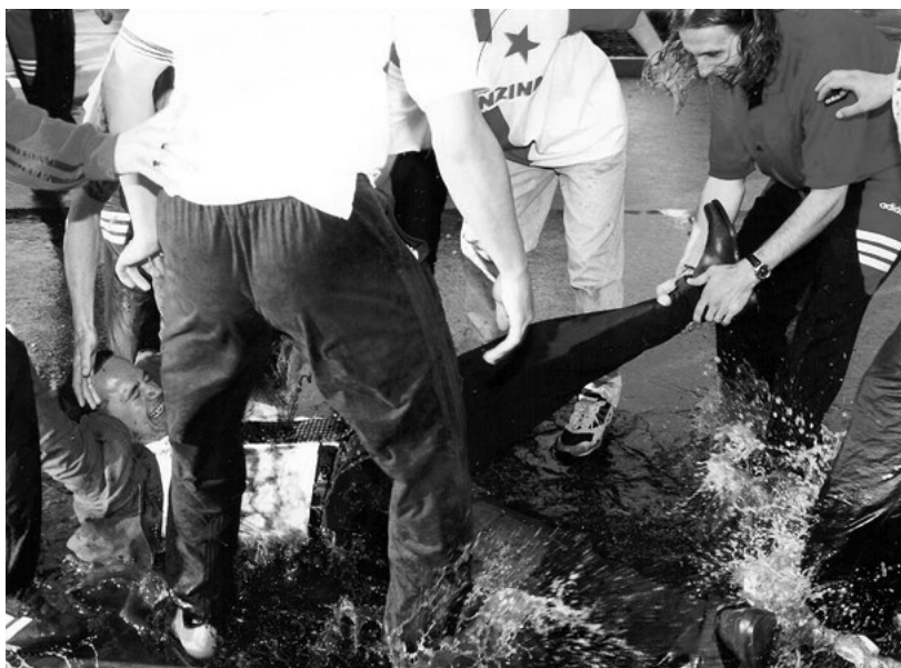
Velký šéf a největší louže.

Náhoda je blbec. Zastavili jsme, abychom protáhli záda, koupili si horalky nebo žvýkačky proti nudě, a za pár minut jsme zažili něco, o čem se vám ani nesní. První titul nic nepřebije. Ani jsem si nestačil uvědomit, co se stalo, a všude kolem už se lepilo rozstříkané šampaňské. Kluci vyskákali z autobusu, div si nezpřelámali nohy. Křičeli,