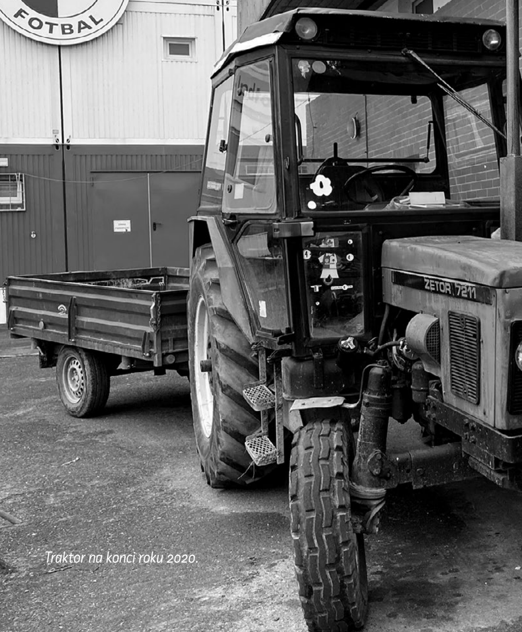
Traktor na konci roku 2020.