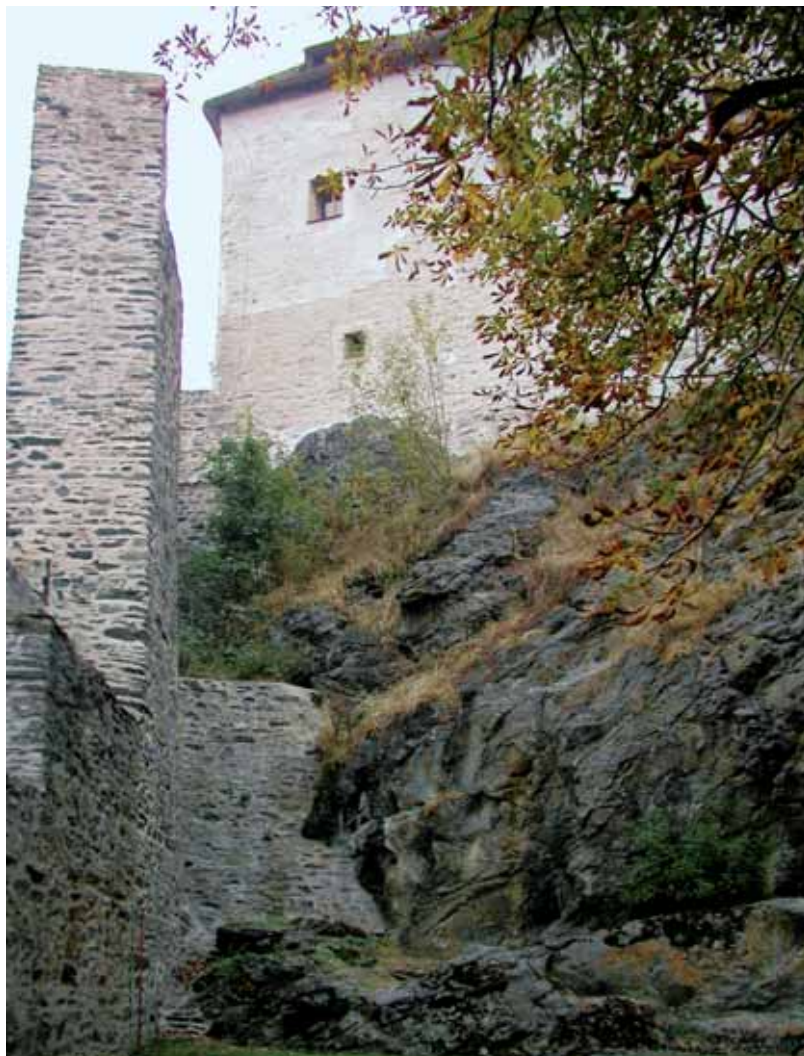
Přitesané rulové a amfibolitové kvádry tvorí zdivo hradu Kámen.

amfibolitů je v okolí hradu více. Vyvýšenina, na které hrad stojí, je dlouhá 200 m, široká jen 50 m. Ačkoli je zdaleka vidět, nad okolí vyčnívá pouhých 30 m. Svahy jsou kamenité, i když nepřiliš strmé. Před hlavním vchodem, kde kdysi byl příkop a padací most, jsou skalky mohutnější. Severní svah je poněkud strmější než svah jižní. Kolem hradu jsou mělké úvaly, vyplněné čtvrtohorními písčitohlinitými sedimenty. Hlavním stavebním materiálem hradu jsou přitesané rulové kvádry a kvádříky, objevuje se i místní amfibolit. Ostění brány je ze žuly.