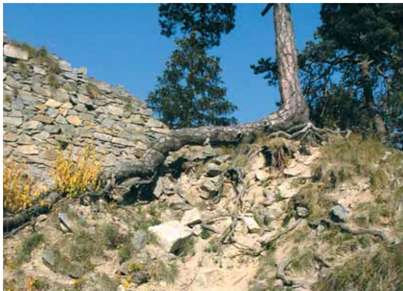
Dívčí Kámen (Maidštejn) v Blanském lese stojí na migmatitové skále a je postaven z lokálních hornin.

16. století byl hrad opuštěn, chátral a měnil se ve zříceninu, části obou paláců se zachovaly.