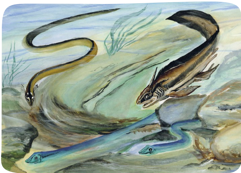
Vlevo nahoře aistopod Phlegethontia , vpravo žralok Xenacanthus , dole obojživelníci rodu Ophiderpeton