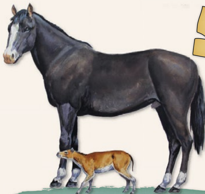
POROVNÁNÍ DNEŠNÍHO A PRAVĚKÉHO KONĚ.

Úplně první nám známé plemeno koní žilo v Severní Americe před 60 miliony lety a od vědců dostalo jméno EOHIPPIUS (v překladu kůň úsvitu dějin). Po nalezení jeho kosterních ostatků si vědci původně mysleli, že jde o pozůstatky kočky nebo lišky, ale po odborném prozkoumání zjistili, že se jedná o prapředka dnešního koně. Ano, byl velký jako liška, byl všežravec (nejvíc mu chutnaly jemné, šťavnaté listy nízkých keřů), a ještě k tomu měl na každé noze pět prstů. Prakoník totiž žil v tropickém pralese, kde se pohyboval po měkké, občas bažinaté půdě, a tak k rozložení váhy potřeboval prsty. Buďte v klidu, divila jsem se úplně stejně.