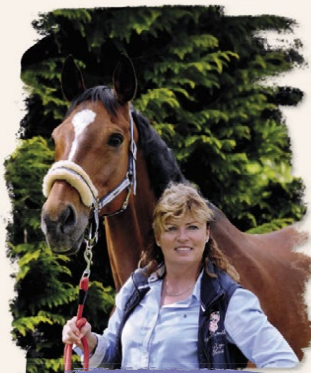
MŮJ VELKÝ KAMARÁD RUBÍN.