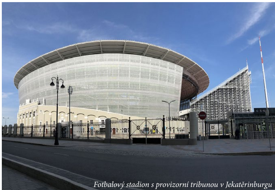
Fotbalový stadion s provizorní tribunou v Jekatěrinburgu

Neplánovaně a narychlo domlouváme schůzku se starým známým, který nás provede centrem a povypráví pár tragikomických historek ze života na Uralu. Nejvíc mi v paměti utkví to, že Jekatěrinburg je ruským epicentrem HIV a podle oficiálních statistik je zde nakažený zhruba každý padesátý člověk. Na první pohled se ve čtvrtém největším městě Ruska snoubí snaha o pokrok a modernost se smutnou historií. Konec carského impéria je tu připomínán na každém kroku. Navštívujeme Jelcinovo centrum s designovými suvenýry a fontánou plnou koupajících se dětí, a potom si nenecháme ujít fotbalový stadion. Na něm se v roce 2018 konalo mistrovství světa ve fotbale a proslul především svým netradičním rozšířením hlediště. Ruští konstruktéři si s nedostatečnou kapacitou stadionu poradili výstavbou provizorních tribun, které jsou v podstatě umístěny na lešení a vysunuty za brankami mimo stadion. Když žijete v Rusku delší dobu a vidíte některá místní technická řešení, tak vás tohle zas tolik nepřekvapí, ale ve FIFA asi museli omdlévat. Objevujeme luxusní restauraci „Gastroli“, která překvapí nejen designovým interiérem, ale především naprosto fantastickým jídlem. Místní pizza je jedna z nejlepších, jaké jsem kdy jedla, a tahle restaurace je