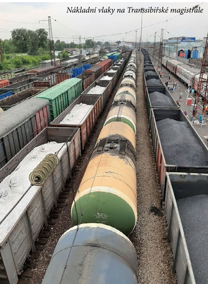
Nákladní vlaky na Transsibiřské magistrále

a už vstupujeme do vlaku, který bude následujících cca 200 hodin naším dopravním prostředkem a hotelem zároveň. Až na jeden úsek cesty jsme si všechny jízdenky koupili do „plackarty“, což je třetí třída, nejlevnější varianta, která u cizinců vzbuzuje vzrušení a u Rusů odpor. Plackarta znamená otevřený vagon, kde jsou lůžka pro 54 cestujících, na začátku každého vagonu je velký kotel s horkou vodou, kde si kdykoliv můžeš zalít čaj nebo instantní polévku, na obou koncích vagonu je toaleta s umyvadlem. Každý takový vagon má svého průvodčího „děžurnovo“, který se