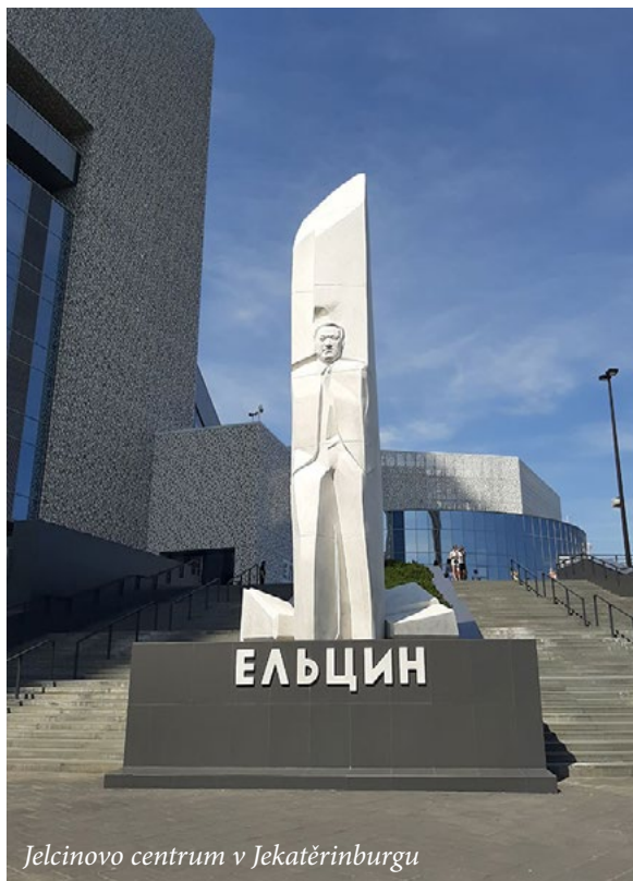
Jelcinovo centrum v Jekatěrinburgu

Po pár hodinách mě vzbudí šílené chrápání, které se line ze všech stran. Karel mi podá špunty do uší, které si kvůli svému lehkému spaní musel vzít už dávno, a díky nim zvládnou spát celkem dobře po zbytek noci. Ráno se vzbudíme okolo sedmé, lehce posnídáme, ale zdá se, že naše biorytmy se okamžitě přizpůsobují rychlosti jízdy, která je v průměru 40 km/hod., a tak znovu usneme. Druhý pokus vstát následuje v deset. To už se budí i zbytek vagonu, včetně našich sousedů, kteří vybalují zásoby jídla, a tak snídáme společně. Má to ale jeden háček. Nemáme zdobný ubrousek, prostírání ani nic podobného, a tak