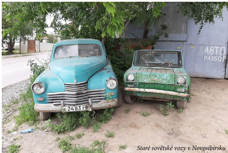
Staré sovětské vozy v Novosibirsku

jako oáza v poušti. Upravení a krásně oblečení lidé sem přijíždějí luxusními auty a tvoří velmi ostrý kontrast se zbytkem města.