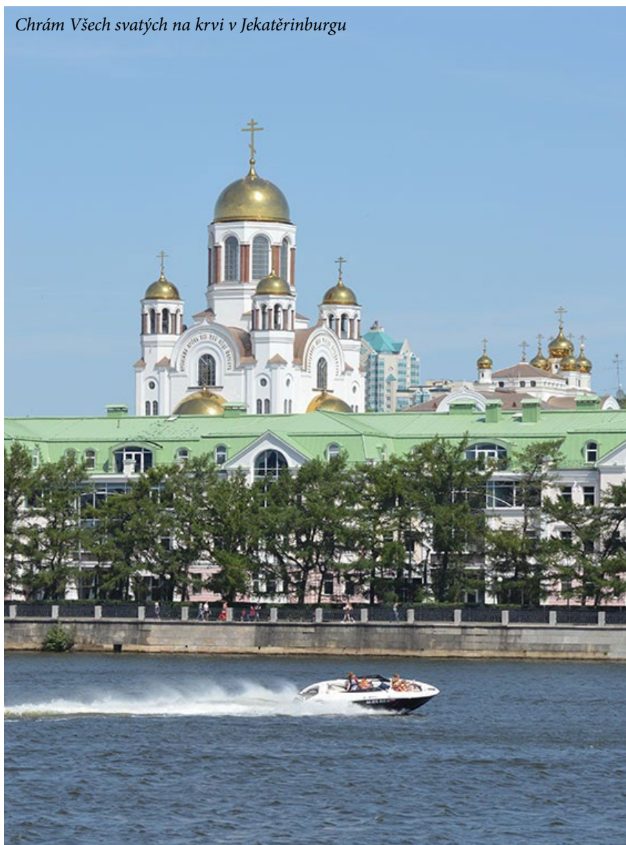
Chrám Všech svatých na krvi v Jekatěrinburgu

jídlo rozprostřeme aspoň provizorně na bílý kapesníček. Naši sousedé nás pohoršeně pozorují, myslí si asi něco o nekulturních prasatech, a potom svůj květinový ubrousek posunou více do středu, abychom si mohli na centrálním stolečku posnídat společně a aspoň trochu důstojně. Téměř s každým soustem šeptají modlitbu a křížují se. Jedou totiž na křížový pochod, pravoslavnou pouť po stopách poslední carské rodiny Romanovců, která tradičně probíhá v polovině července. Plánují pěšky v průvodu absolvovat trasu od Chrámu všech svatých na krvi v Jekatěrinburgu, kde byla rodina Mikuláše II. zastřelena,