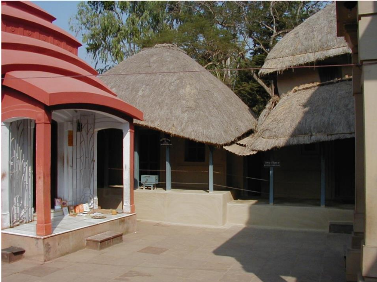
Domek v Kamarpukuru, kde žil Rámakrišna.

Zrozený v ortodoxní bráhmanské rodině znal Šrí Rámakrišna bohoslužebné formality, ceremoniály a rituály. Nespočetní bohové a bohyně hinduistického náboženství jsou lidskými aspekty nepopsatelného a nepochopitelného ducha v pojetí konečné lidské mysli. Chápu a oceňují lidskou lásku a emoce, pomáhají lidem, aby si uvědomili své světské a duchovní ideály, a hlavně umožní člověku dosáhnout osvobození z bídy fenomenálního života. Zdroj světla, inteligence, moudrost a síla samotné jednoty, ze které pochází naplnění tužeb. Přesto dokud je člověk vázán lidskými omezeními nedokáže uctívat Boha bez pomoci lidské podoby. Musí použít lidské symboly. Proto hinduismus požaduje od ctitelů, aby nahlíželi na Boha jako na ideálního otce, ideální matku, ideálního manžela, ideálního syna, nebo ideálního přítele. Ale pojmenovatelné vede nakonec k Nepojmenovatelnému, forma k Bestvarému, slovo k Tichu, emoce k pokojnému uskutečnění Míru v Bytí-Poznání-Blaženosti absolutna. Bohové postupně splynou s jediným Bohem. Ale dokud není dosaženo realizace, nemůže ctitel vyloučit lidského činitele ze svého uctívání. Proto je Božstvo koupáno a odíváno a zdobeno. Krmí ho a ukládají ke spánku. Je usmiřováno chvalozpěvy, písněmi a modlitbami. A existují vhodné ceremoniály spojené se všemi těmito funkcemi. Například aby zajistil kněz vnější čistotu, koupe se sám ve svččené vodě a obléká si posvěcené oblečení. Očišťuje svou mysl a smyslové orgány vhodnými