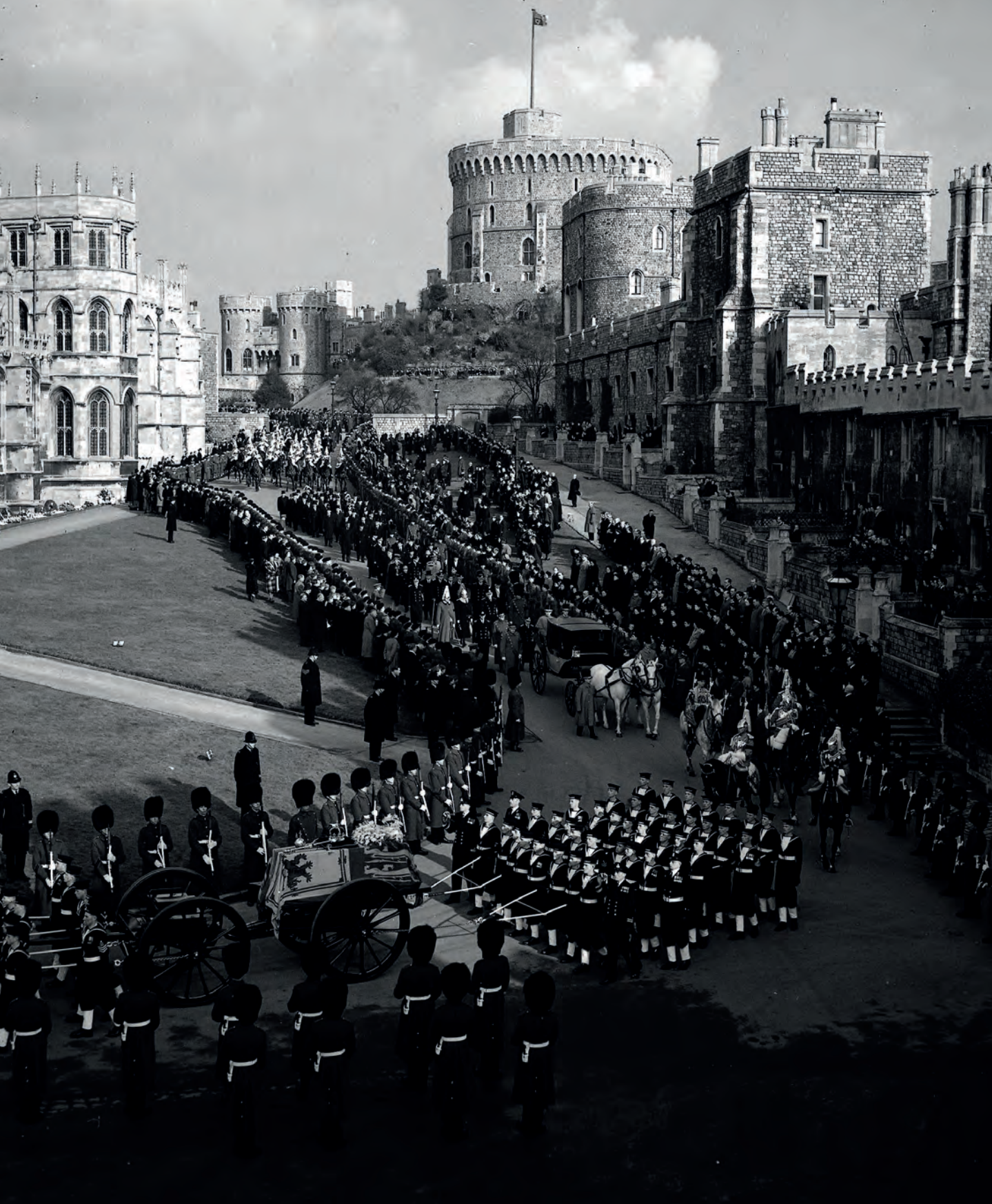
Pohřeb Jiřího VI. 15. února 1952