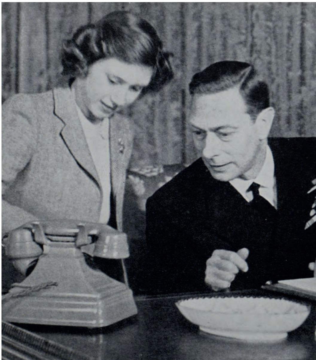
Princezna Alžběta a Jiří VI. v Buckinghamském paláci

připravoval na následnictví trůnu, Alžběta však ve skutečnosti nikdy necestovala bez černých smutečních šatů a na všechny cesty s sebou vozila kopii projevu k nástupnictví, který byla připravena pronést. Je tedy velmi nepravděpodobné, že by si král v tomto stadiu myslel, že je zachráněn.