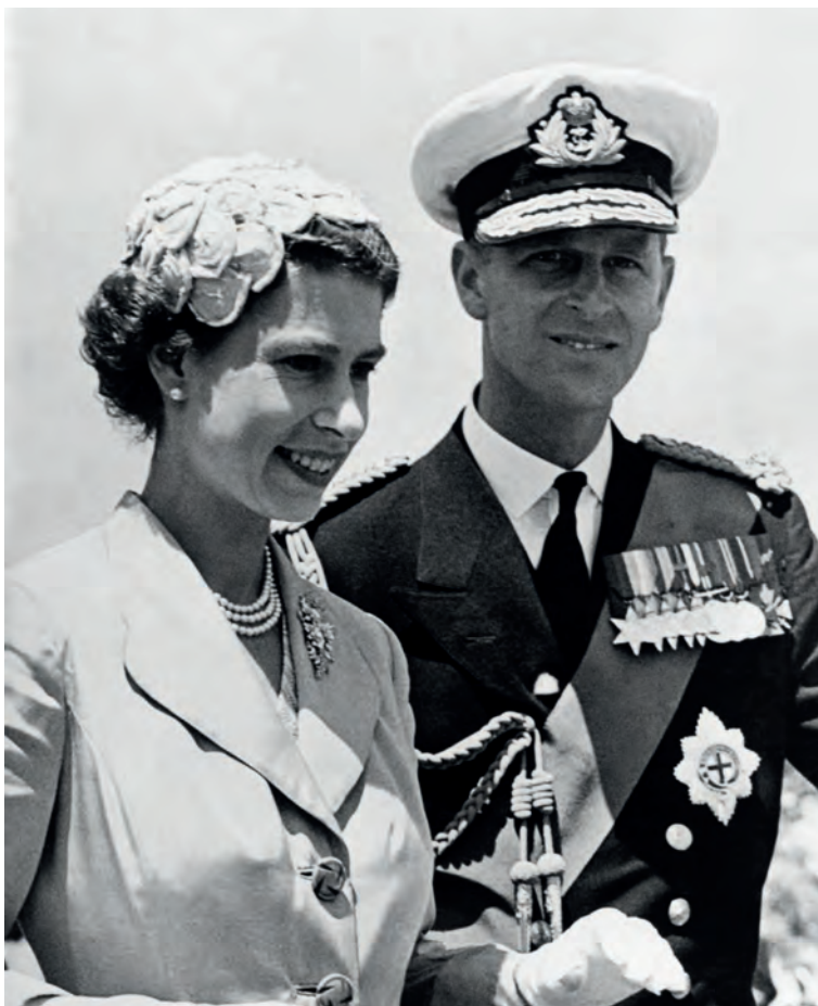
Alžběta II. a princ Filip na cestě v Keni v roce 1952

citovaných v BBC se spolu začali stýkat až po smrti krále, když se Townsend stal pobočníkem královny, ale hlavně až po jeho rozvodu.