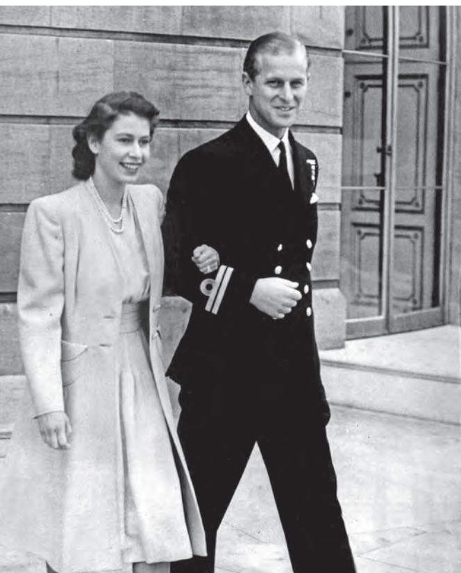
Červenec 1947. Princezna Alžběta a Filip Mountbatten právě oznámili svůj sňatek.

Je 19. listopadu 1947. Alžběta, které je 21 let, se chystá provdat za téměř o pět let staršího Filipa. Je to mladý pár jako spousta jiných, ovšem s malým rozdílem. Alžběta z Windsoru je nejstarší dcerou krále Jiřího VI., a tedy dědičkou anglického trůnu.