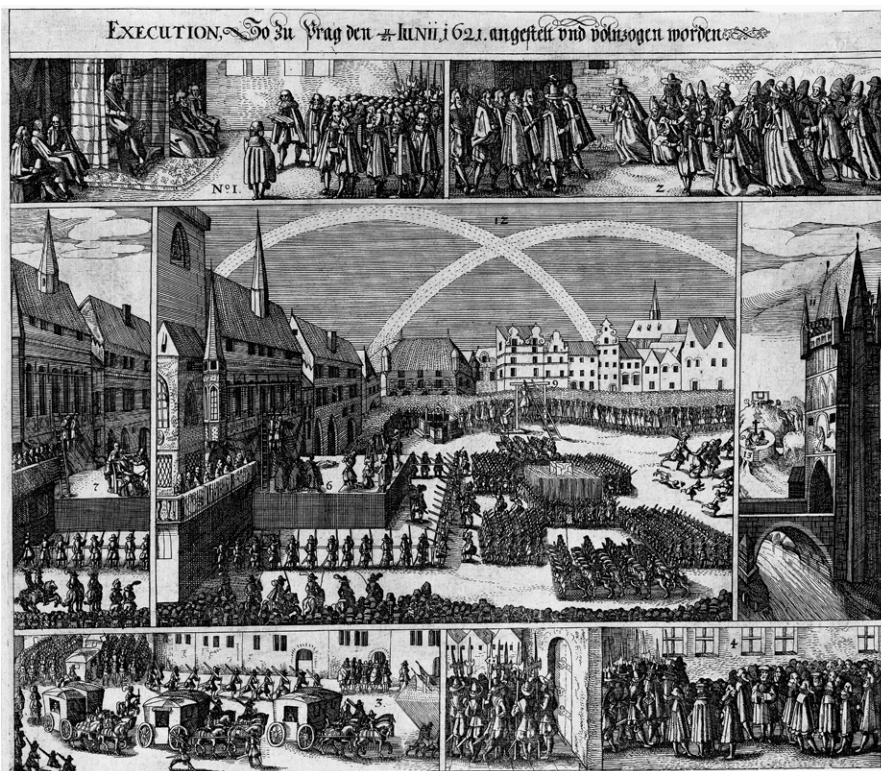
Matthäus Merian st.: Staroměstská exekuce , in: Theatrum Europaeum (1633–1635), mědiryt, 273 × 323 mm

„A hned při samém východu slunce zvěstováno, že velmi pěkná duha na nebi se ukázala. Vyběhli kněží, vojáci a jiní, mučedlníci pak z oken se dívali a viděli všickni, jako i celá Praha, neobyčejné jasnosti duhu, an nebe jasné bylo, když ode dvou dní před tím ani po tom deště nebylo...“ ( Historie o těžkých protivenstvích )