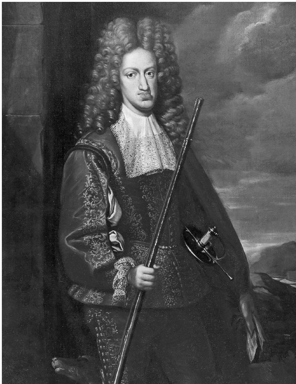
Španělský král Karel II.