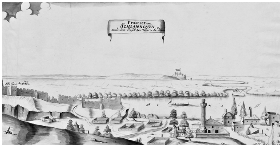
Slankamen poblíž ústí Tisy do Sávy, v pozadí rakouská pevnost Titel.

k Evropě, jak se „Bílému hradu“ někdy říkalo, se najednou spolu s Temesvárem stala hraniční pevností.