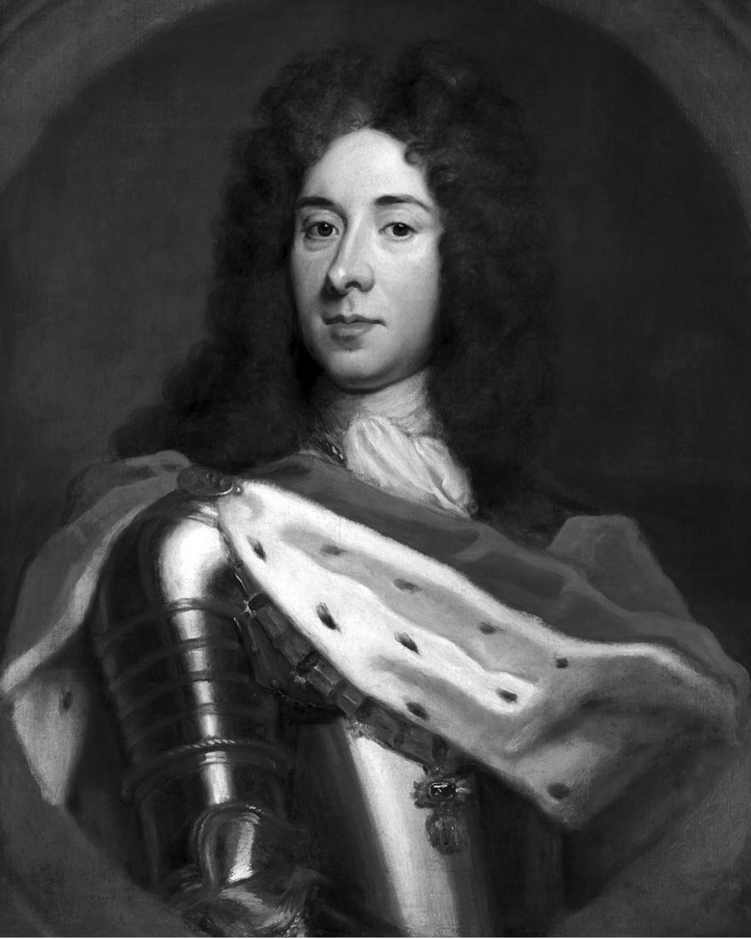
Evžen Savojský na portrétu z roku 1712.