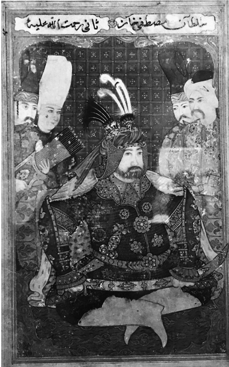
Osmanský sultán Mustafa II.