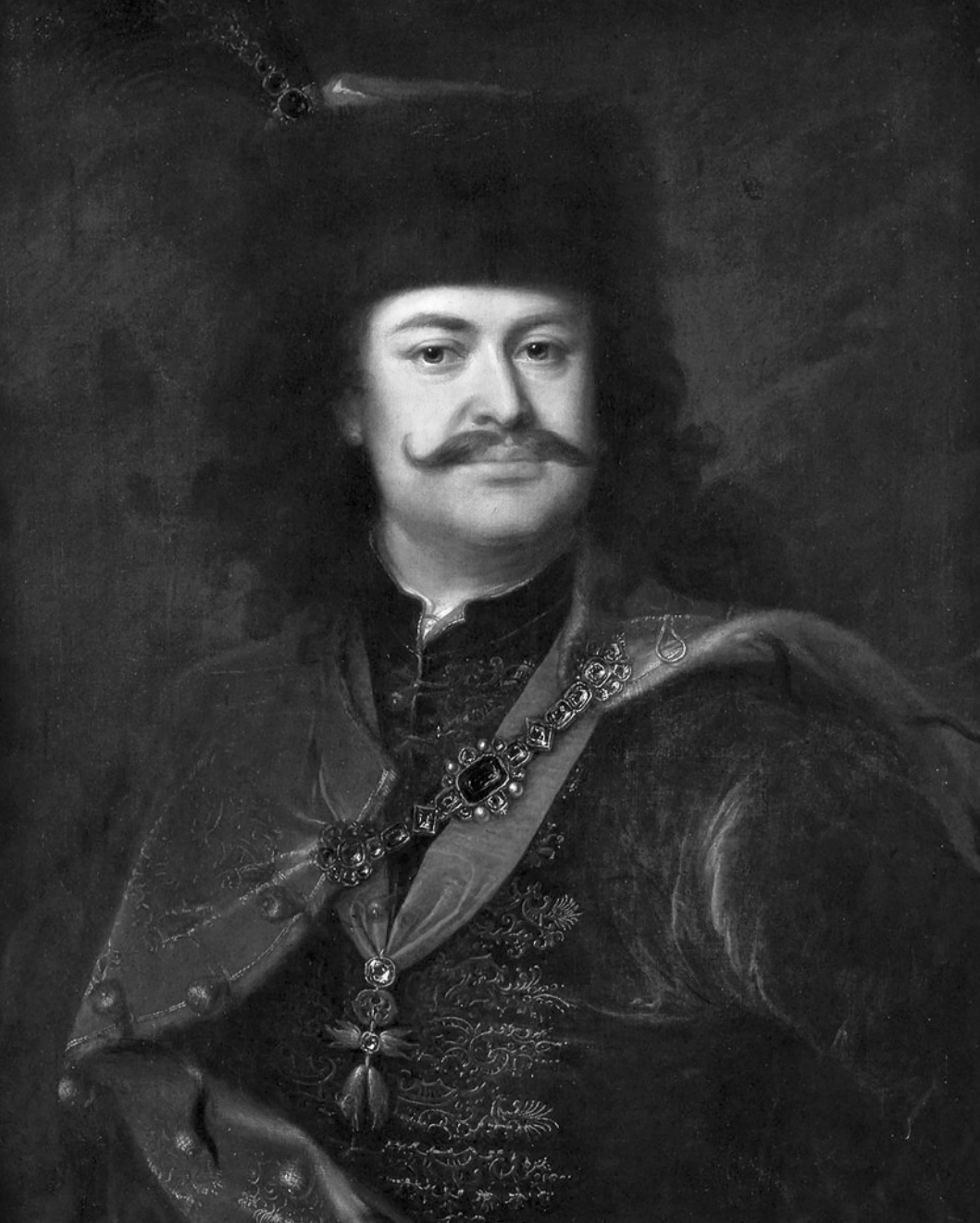
Ferenc Rákóczi, vůdce protihabsburského povstání v Uhrách v letech 1703–1711.