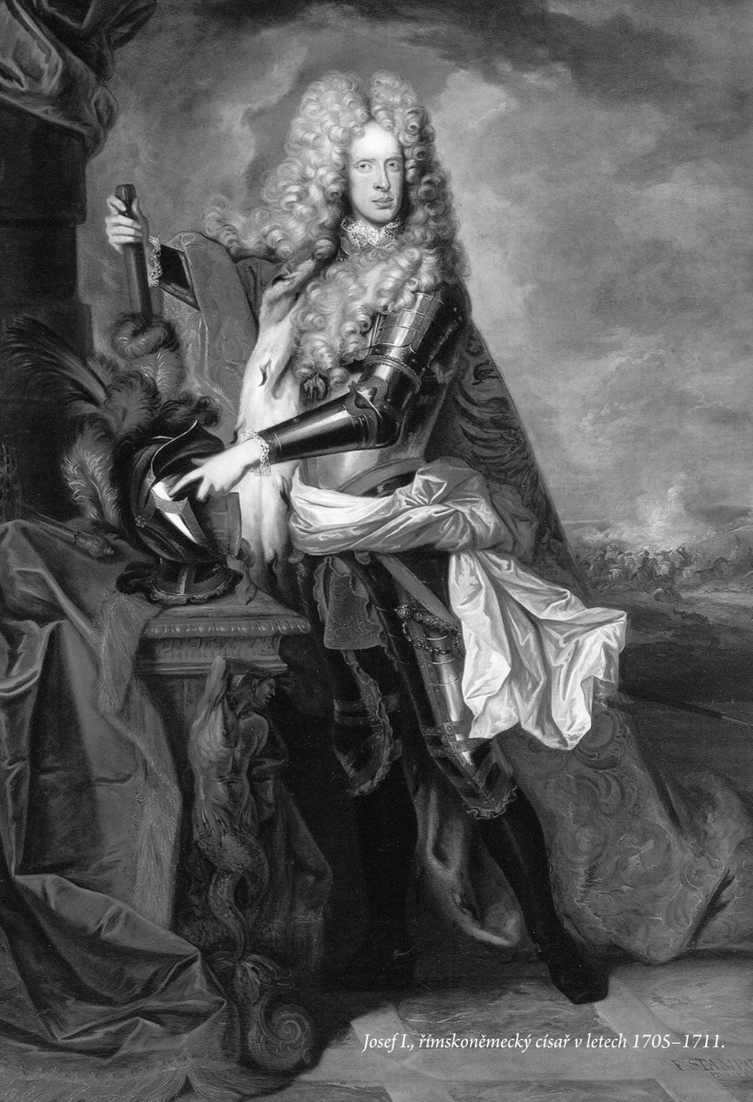
Josef I., římskoněmecký císař v letech 1705–1711.