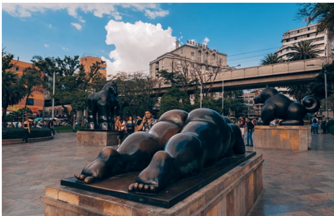
Boterovy sochy v centru Medellínu umí vyvolat u turistů upřímné úsměvy.

Když projíždíte třetí linku lanové dráhy, kocháte se výhledy na kopcovité město a s respektem pozorujete cvrkot ve favelách pod vámi, uvědomíte si, že je Medellín místem obrovských protikladů. Na jednu stranu není problém dát za luxusní steak v restauraci u Boterova náměstí, které