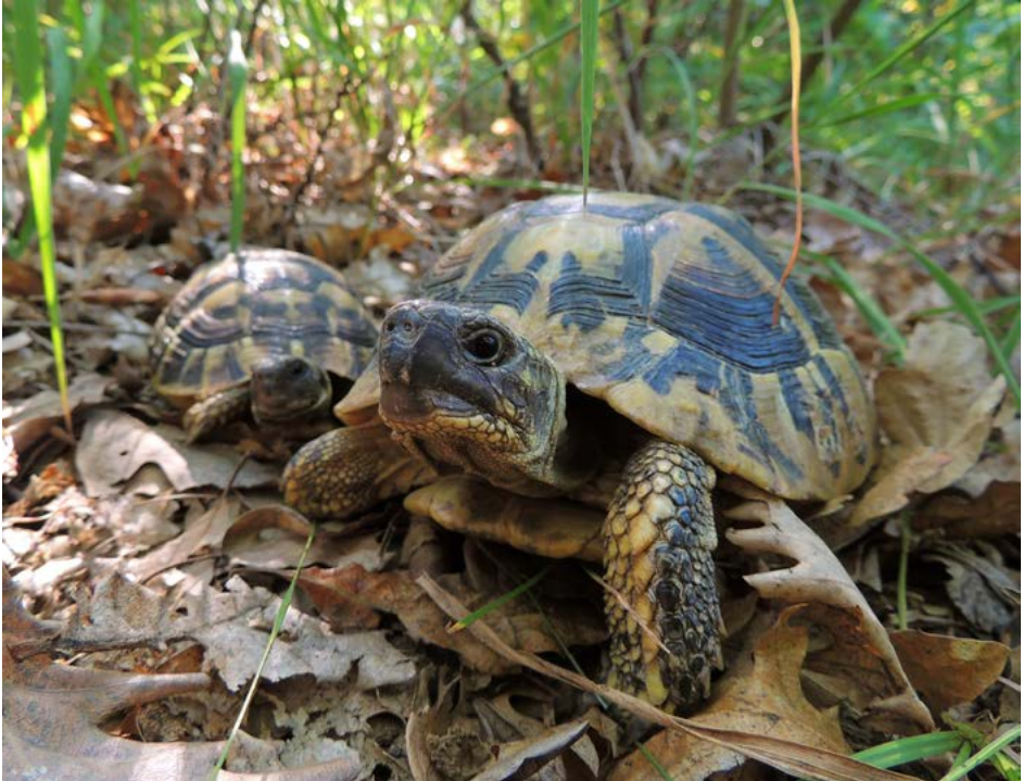
Želva zelenavá ( Testudo hermanni boettgeri )