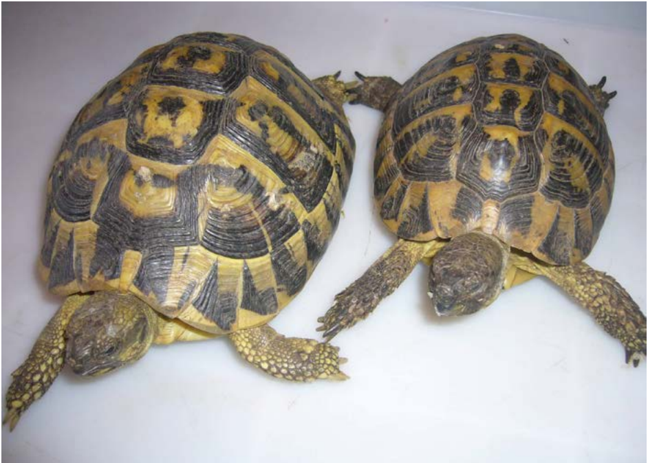
Dospělé želvy Testudo hermanni hermanni : velikost samce (vpravo) a samice