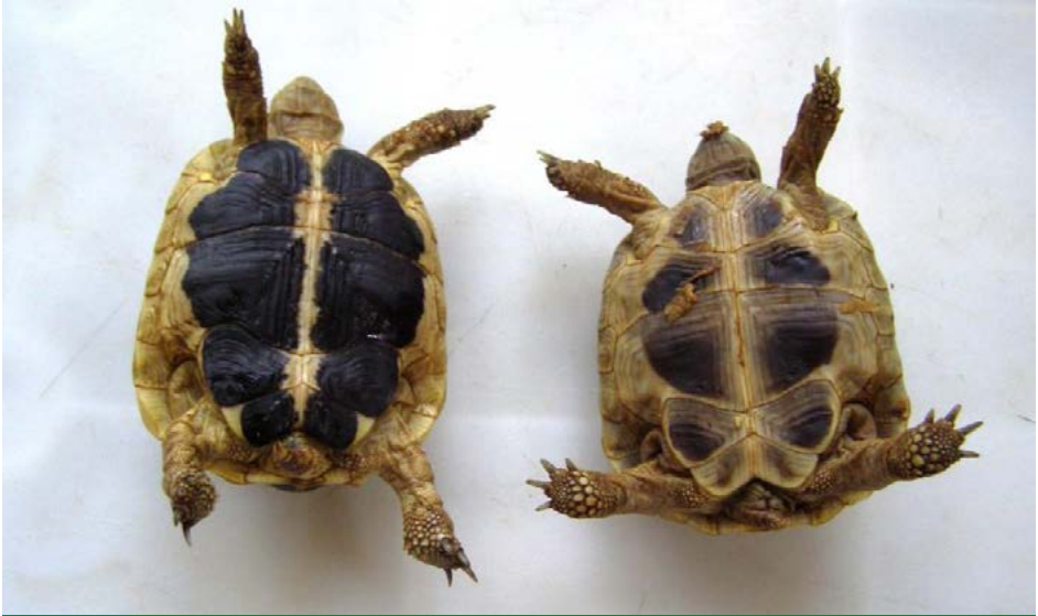
Barevný rozdíl mezi mláďaty želv Testudo hermanni hermanni (vlevo) a Testudo hermanni boettgeri