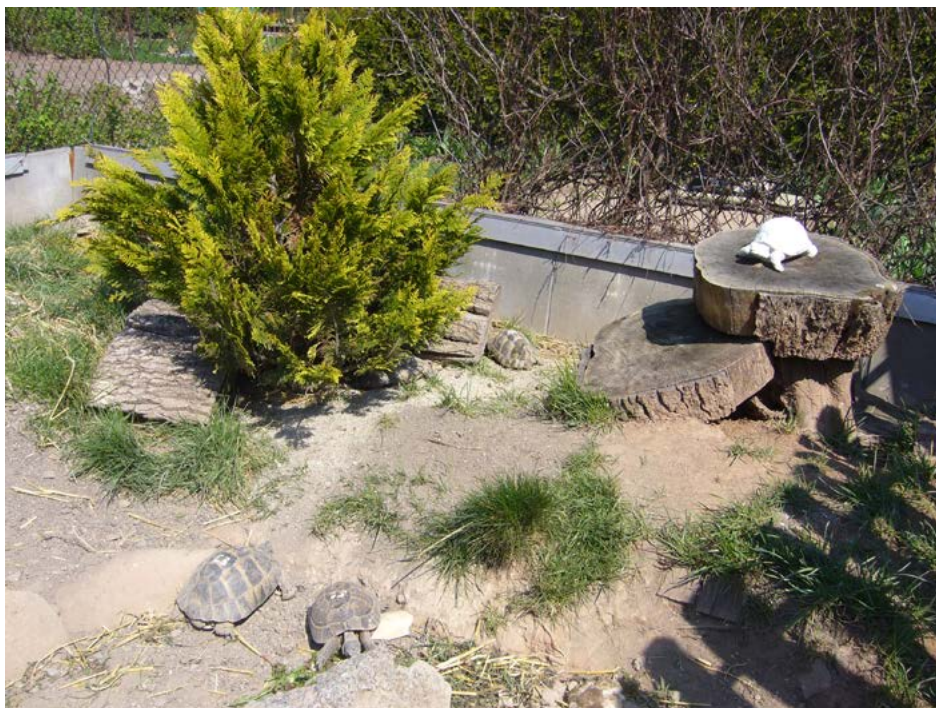
Ukázka podoby společného venkovního výběhu určeného pro želvy zelenavé a želvy žlutohnědé

Podle výskytu se tento druh dále (pozor, zcela neoficiálně – v úředních dokladech bude vždy stát pouze Testudo hermanni ) dělí na poddruhy Testudo hermanni boettgeri (želva zelenavá běžná) a Testudo hermanni hermanni (želva zelenavá menší). V přírodním prostředí se želva zelenavá běžná vyskytuje na velmi rozsáhlém území začínajícím na západě Evropy na Pyrenejském poloostrově, pokračujícím na východ přes Itálii, bývalou Jugoslávii, Albánii, Rumunsko, Bulharsko, Řecko a končícím v západním Turecku. Poddruh Testudo hermanni hermanni se vyskytuje hlavně na západě kontinentu, ve Francii, Španělsku a na Baleárech (zde v nadmořské výšce 500–600 m n. m.). Rozdíl mezi nimi je nepatrný hlavně ve zbarvení ( Testudo hermanni hermanni jsou na plastronu – spodní části krunýře – výrazně podélně černé) a velikosti. Určení těchto poddruhů je vyloženo doménou odborníků a laik vlastně nemá šanci je od sebe rozpoznat. Nicméně pro úplnost informací dodejme, že, zjednodušeně řečeno, poddruh želva zelenavá běžná ( Testudo hermanni boettgeri ) dorůstá velikosti 17–25 cm a o něco menší poddruh želva zelenavá menší ( Testudo hermanni hermanni ) velikosti 14–17 cm. Tak jako u všech druhů želv jsou uvedené rozměry pouze orientační a určitě se najdou jedinci, kteří budou vyčnívat z řady, přičemž vliv má i lokalita výskytu. Zjednodušeně lze např. konstatovat, že čím více na východ (Chorvatsko/