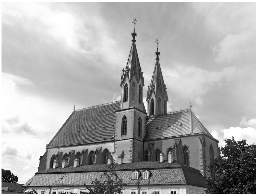
Kroměřížský kostel sv. Mořice

1889. Svoji primici následně slavil z úcty ke svým rodičům a prarodičům v Dřevohosticích o týden později. Poté působil rok v pastorační správě v Dubu nad Moravou, odkud byl jako kaplan poslán do Věčného města. Jeho novým domovem se stala římská kolej pro kněze z německy hovořících zemí Santa Maria dell'Anima. Sám byl během studia teologie v přehledu studentů veden jako Němec.