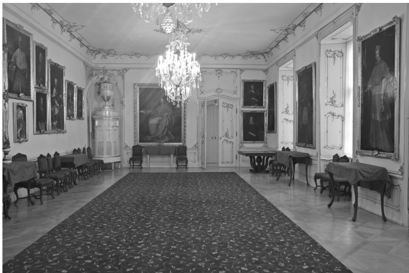
Sál s podobiznami arcibiskupů v Arcibiskupském paláci