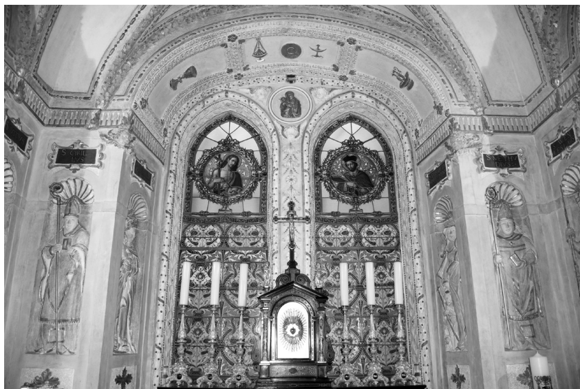
Domácí kaple sv. Jana Křtitele v Arcibiskupském paláci