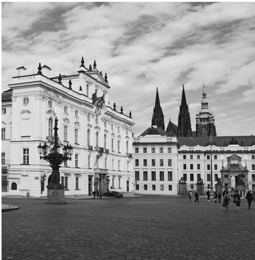
Arcibiskupský palác se nachází v těsném sousedství prvního nádvoří Pražského hradu

ho arcibiskupa, kterou zastával. V rámci Rakousko-Uherska byl jedním ze šesti zástupců v kardinálském sboru. Svým věkem, bylo mu tehdy 37 let, patřil mezi nejmladší kardinály vůbec.