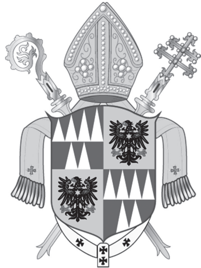
Znak Arcidiecéze olomoucké

Ve Lvu Skrbenském zemřel církevní hodnostář úzce spjatý s osudem habsburské monarchie. Třebaže se vždy hlásil k českému původu, byl zejména po roce 1918 vnímán jako představitel aristokratických rakouských kruhů konzervativního ražení. Navzdory své