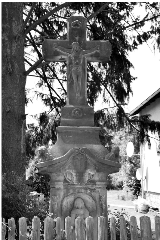
Krucifix v Seleticích, rodišti Františka Kordače

v diecézi, což s sebou přinášelo i zapojení do určitých oblastí správy církevních záležitostí a zasahování do řízení místní církve.