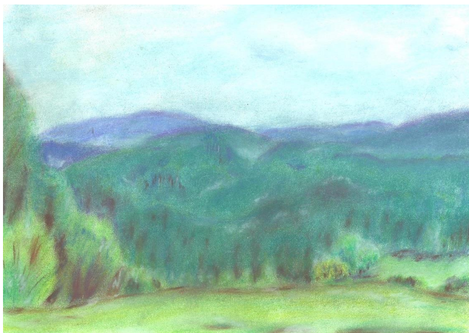
Okno do Šumavy

Krásné je být v tu chvíli na Šumavě. A když nad krajem zavládne hluboká šumavská noc, na nebi plují hvězdy a měsíc se zdá být skoro na dosah ruky, je čas na tu nejkrásnější pohádku, kterou napsal sám život. Pohádku o zálesákovi a víle.