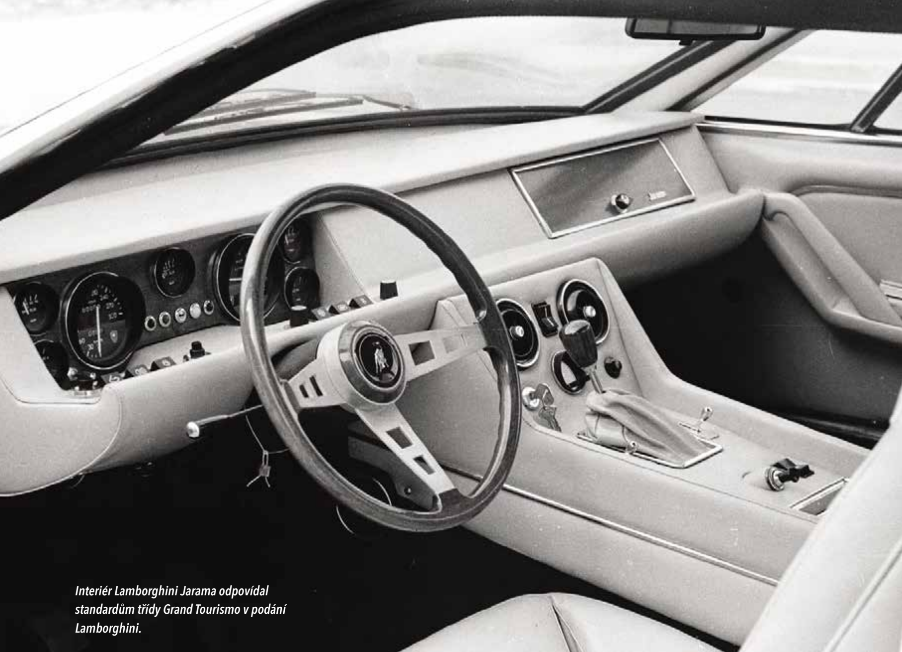
Interiér Lamborghini Jarama odpovídal standardům třídy Grand Tourismo v podání Lamborghini.