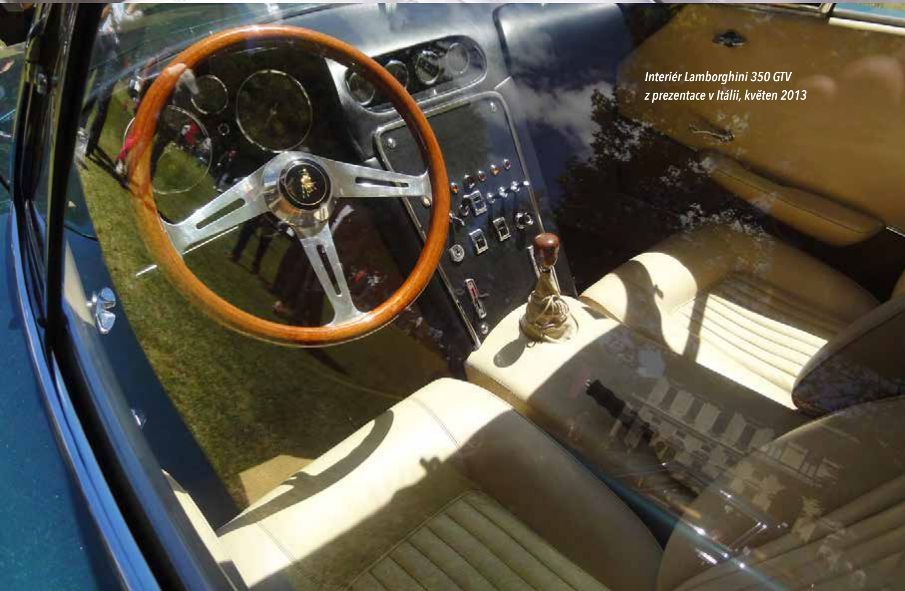
Interiér Lamborghini 350 GTV z prezentace v Itálii, květen 2013