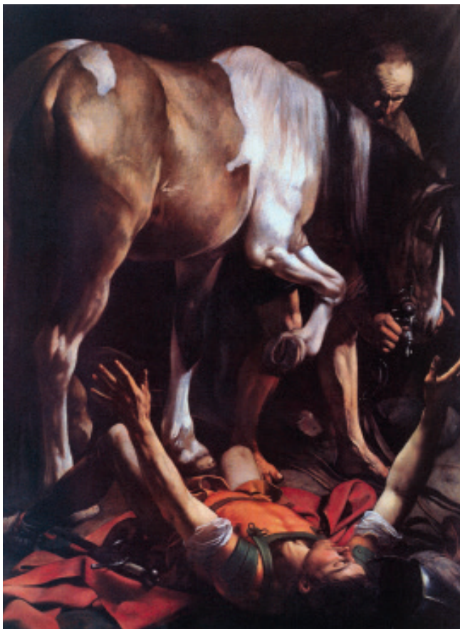
1 „A zároveň musíme být ochotni prozřít.“ Michelangelo Merisi da Caravaggio, Obrácení sv. Pavla , 1600–1601, Řím.