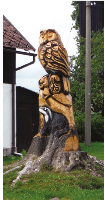
Ukázky řezbářských děl vytvořených z kmenů odumřelých stromů