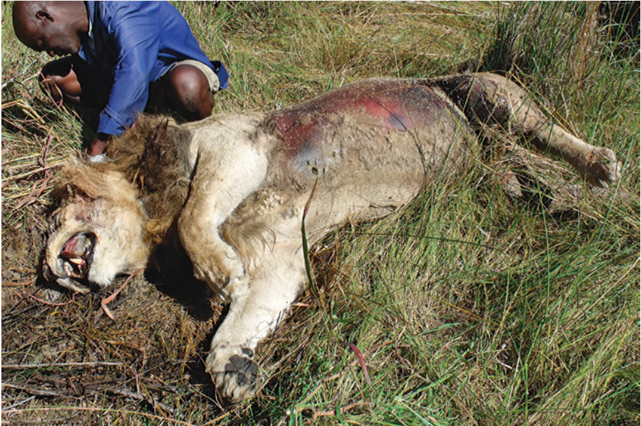
Obr. 1.2 Odveta za zabítí několika kusů dobytka. Dospělý samec lva byl zastřelen místními a ponechán svému osudu. Odvetné pytláctví stojí za snížením početnosti lvů v deltě řeky Okavango. Botswana.

kontaktem s pokožkou. Po požití větší dávky dochází k celkovému ochrnutí a smrti na následky udušení. Malé opakované dávky vedou k smrti až po několika dnech, kdy dochází k narušení termoregulace a změně chování, včetně schopnosti úniku před predátory. Pouze malá část otrávených ptáků a savců je však nalezena a dokladována. Není proto prakticky možné vyhodnotit celkový efekt travičství. Zapomenout nelze ani na možnost sekundárních otrav, kdy se dravec otráví po pozření jiného živočicha, který předtím sežral otrávenou návnadu. Zvláště zranitelní jsou proto ptáci živící se mršinami. V posledních letech jsou doloženy opakované otravy orla mořského ( Haliaeetus albicilla ). Přitom jde o kriticky ohrožený druh, největšího orla Evropy a dravce v ČR (obr. 1.3). Databázi nálezů potvrzených otrav a další zajímavé informace najdete na stránkách karbofuran.cz .