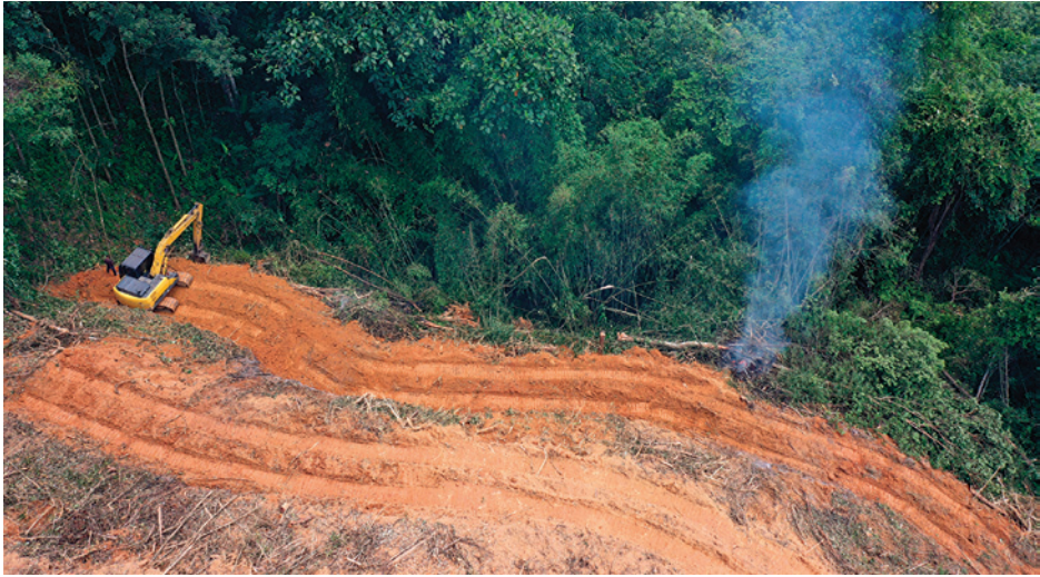
Obr. 1.1 Snižování rozlohy tropických lesů je považováno za učebnicový příklad negativního vlivu člověka na živou přírodu a jeho střetu s ní. Malajsie.

zábořem stále dostupné původní přírodní krajiny. V mnoha případech je tomu tak i dnes. Extenzivní zemědělství je ve své extrémní podobě reprezentované mediálně známými případy pěstování palmy olejné ( Elaeis guineensis ), kdy novým plantážím stále ustupují původní tropické deštné lesy.