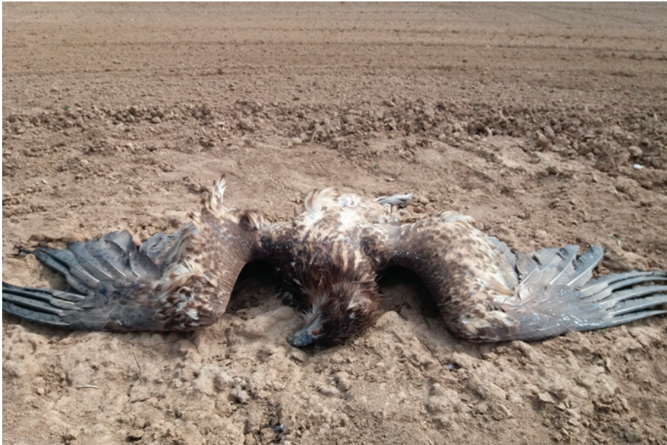
Obr. 1.3 Karbofuranem otrávený orel mořský z dubna 2019 nalezený nedaleko Kolína.

areálům a potravním návykům, pro člověka hrozbu, ať již skutečnou nebo subjektivně vnímanou [16]. Velké šelmy vždy přitahoval extenzivní chov dobytka, jelikož energie vynaložená na lov je v těchto podmínkách, ve srovnání s lovem kořisti ve volné přírodě, minimální. Tato situace následně vedla k vyhocení konfliktu a redukci početního stavu většiny velkých šelem a místy k jejich úplnému vymizení. V Evropě, Severní Americe a Asii se to hlavně týká již zmíněných vlků, v Africe lvů ( Panthera leo ) a v Asii tygrů ( Panthera tigris ).