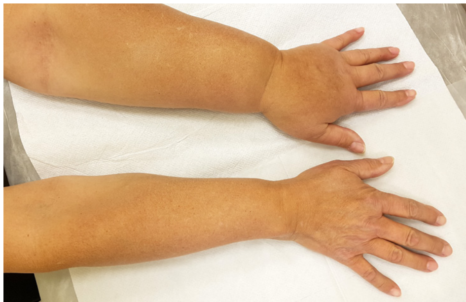
Obr 1.2 Lymfedém levé horní končetiny po mastektomii a exenteraci axily vlevo pro pokročilý karcinom prsu s postižením axilárních uzlin

Rehabilitační léčba a fyzioterapie je zaměřena na dlouhodobé následky onkologické léčby zahrnující lymfedém (obr. 1.2), bolestivé syndromy (postamputační, postmastektomický, postradiační, myofasciální), hormonální dysregulace, dysfunkce pánevního