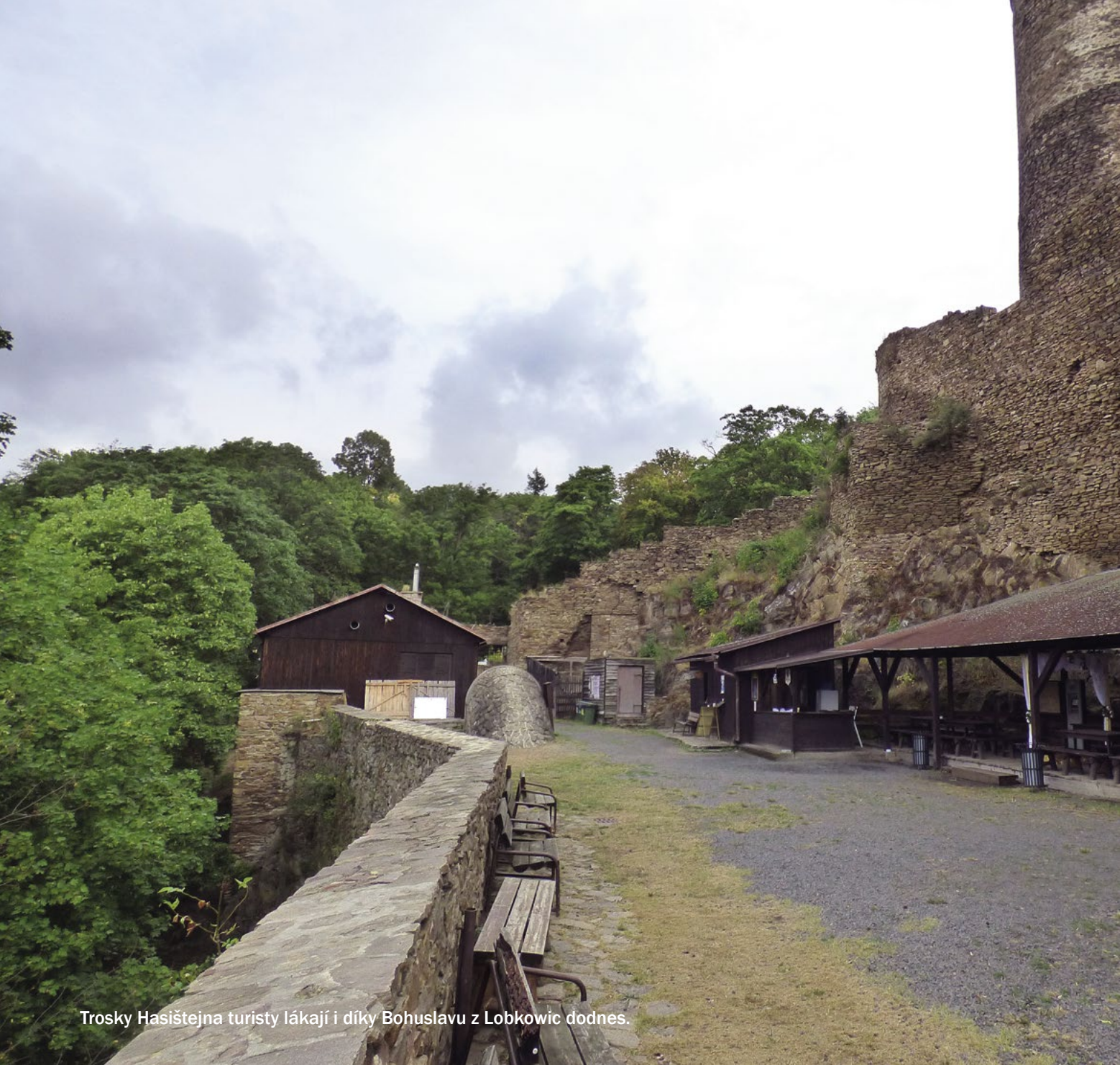
Trosky Hasištejna turisty lákají i díky Bohuslavu z Lobkovic dodnes.