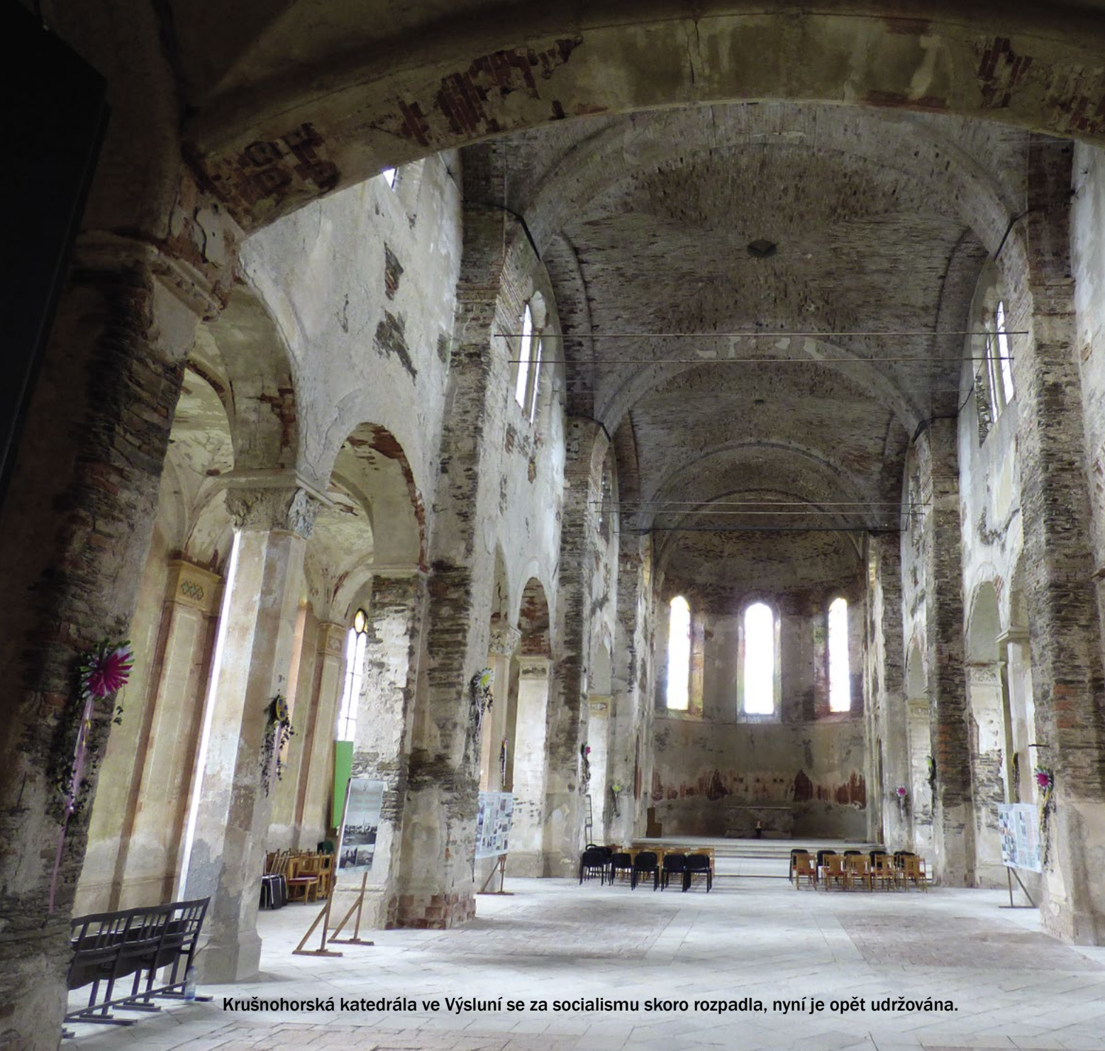
Krušnohorská katedrála ve Výsluní se za socialismu skoro rozpadla, nyní je opět udržována.