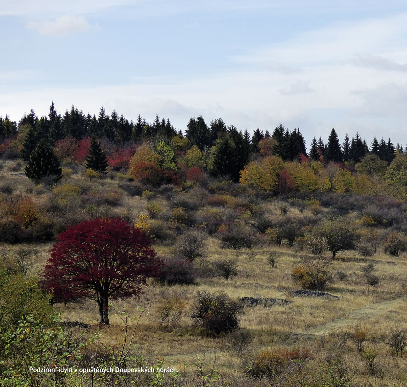
Podzimní idyla v opuštěných Doupovských horách.