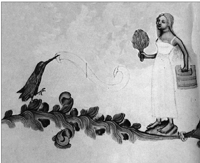
Václavův ledňáček a lazebnice z bordury Bible Václava IV. (wikipedie)

až za hrob. Po smrti manžela se žalem vrhla do moře, bohové dojatí silou jejího citu ji však proměnili právě v ledňáčka.