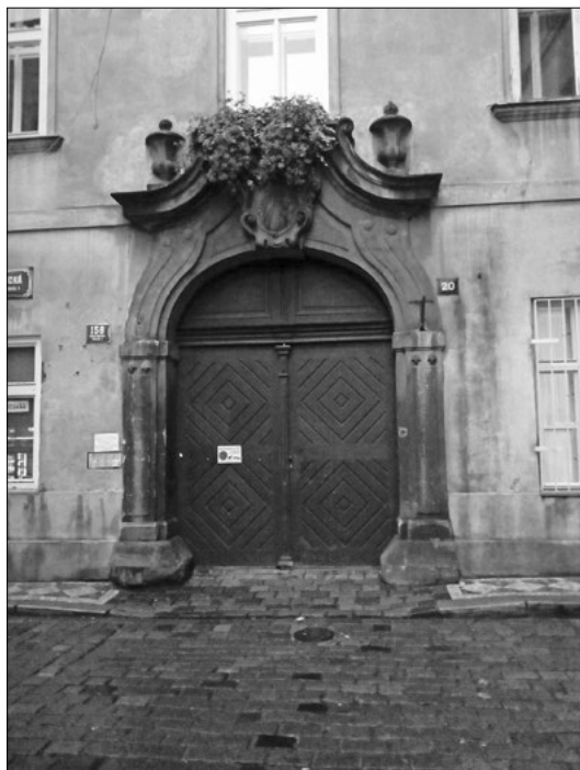
Dům s tíarou v Opatovické ulici čp. 158

Podrobnější rozbor této povídky snadno ukáže, že tato verze pověsti o založení Prahy je pouze Meyrinkovou fantazií. Přesto však poněkud zarazí fakt, že Karel IV. (1316–1378) a Cola di Rienzo (1313/4–1354) se osobně znali, že di Rienzo znal Francesca Petrarca (1304–1374) a že si Petrarca dopisoval s Karlem IV. a později se s ním také setkal. Pokud se opravdu nejednalo o nějaké tajné společenství, potom určité intriky spolu sprádali zcela jistě. Netýkaly se ničeho menšího než ovládnutí tehdy roztržštěné Itálie a nakonec celé Evropy, tedy celého tehdy známého světa.