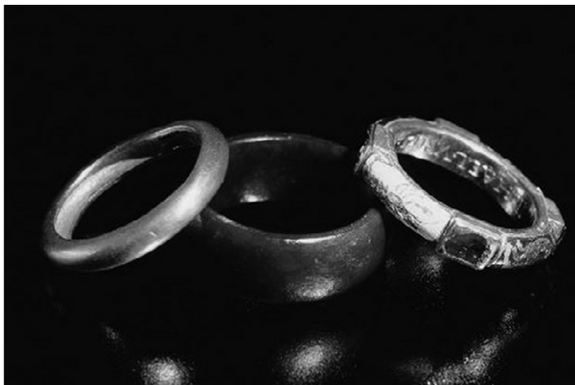
Tři prsteny Rudolfa II.

Pro všechny tři prsteny platí, že je císař skutečně běžně a zřejmě denně nosil, protože jeví příslušné známky opotřebení. Zmiňuje se o nich údajně také alespoň jedna dobová zpráva, která to však je, dnes nikde uvedeno není. Toto tvrzení je tedy třeba prozatím brát jako nejisté, možná už dlouho tradované jako „fakt“, který prostě nikdo co do jeho pravdivosti neověřoval.