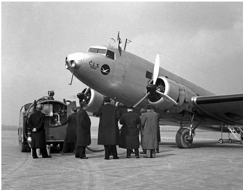
Obrázek 11: Letadlo Douglas DC-2 Československé letecké společnosti, které přistálo jako první na letišti Praha-Ruzyně po jeho otevření, a to na lince Piešťany–Zlín–Brno–Praha, 5. 4. 1937. 100

V roce 1938 udržovala Československá letecká společnost provoz na těchto tratích: 1) Praha–Drážďany–Berlín; 2) Praha–Vídeň; 3) Praha–Mnichov–Curych–Ženeva–Marseille; 4) Londýn–Rotterdam–Praha–Vídeň–Budapešť. 101 Je tedy zřejmé, že v okamžiku, kdy byly ČSA připraveny rozšiřovat svoji leteckou síť do zahraničí, množství výnosnějších „západních“ linek již obsadila ČLS. Nezanedbatelnou konkurenční výhodou ČLS představovala i skutečnost, že – na rozdíl od ČSA – nebyla vázána povinností nakupovat tuzemskou leteckou techniku. Když na počátku třicátých let tyto aerolinie plánovaly obnovení letadlového parku, českoslovenští výrobci nenabízeli „stroj, který by vyhovoval rychlostí a užitečným zatížením“. A tak po vyloučení německých letounů Junkers Ju-52 především z politických důvodů nakonec ČLS nakoupila americký typ moderního letadla Douglas DC-2. 102