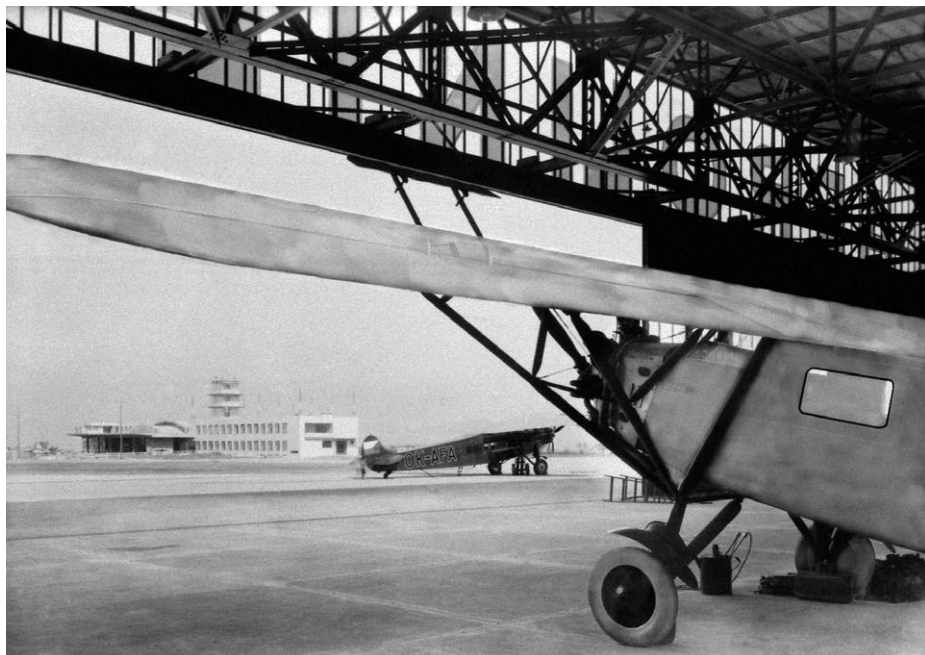
Obrázek 9: Letiště Praha-Ruzyně jen několik dní před slavnostním zahájením provozu – výhled z hangáru, 24. 3. 1937

a dalších více než 9000 tranzitně do ostatních západních zemí. 86 V roce 1938, ještě před mnichovskými událostmi, byl zaveden spoj Bratislava–Budapešť, a naopak linka do Moskvy byla zrušena. Významný milník rozvoje civilní letecké dopravy v předválečném období pak představovalo otevření nového státního letiště v Praze-Ruzyni 5. dubna 1937, 87 kam byl převeden provoz dopravních letadel z dosud využívaného letiště Praha-Kbely. 88