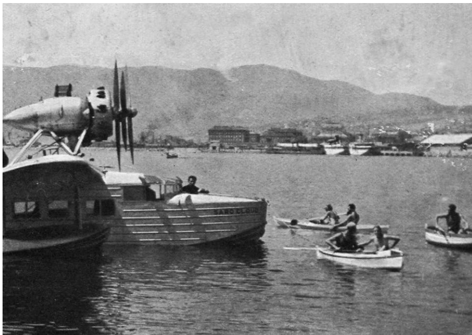
Obrázek 6: Hydroplán ČSA na hladině moře u ostrova Susak v roce 1935. S pomocí tohoto „obojživelného letadla“ ČSA pro letní sezónu 1936 otevřely první československou námořní leteckou linii mezi přístavy Sušak a Split, která byla později na čas prodloužena do Dubrovníku. 65

na dispošice. V té době se spřátelil s cestujícími a šťastné nouzové přistání [...] bylo v družné zábavě oslaveno.“ 64 Příčinou havárie však mohly být i jiné, velmi špatně předvídatelné okolnosti než jen počasí nebo technická závada.