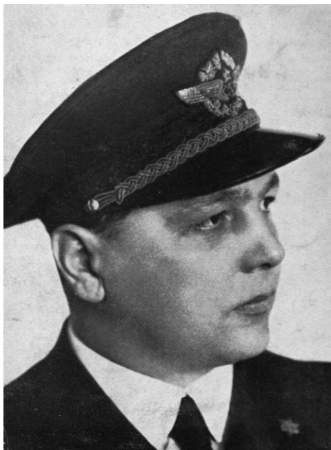
Obrázek 4: Pilot Karel Brabenec, který provedl zahajovací let Československých státních aerolinií z Prahy do Bratislavy dne 29. října 1923.

kromě neděle; během tohoto jednoměsíčního provozu bylo přepraveno celkem dvacet devět cestujících. 58