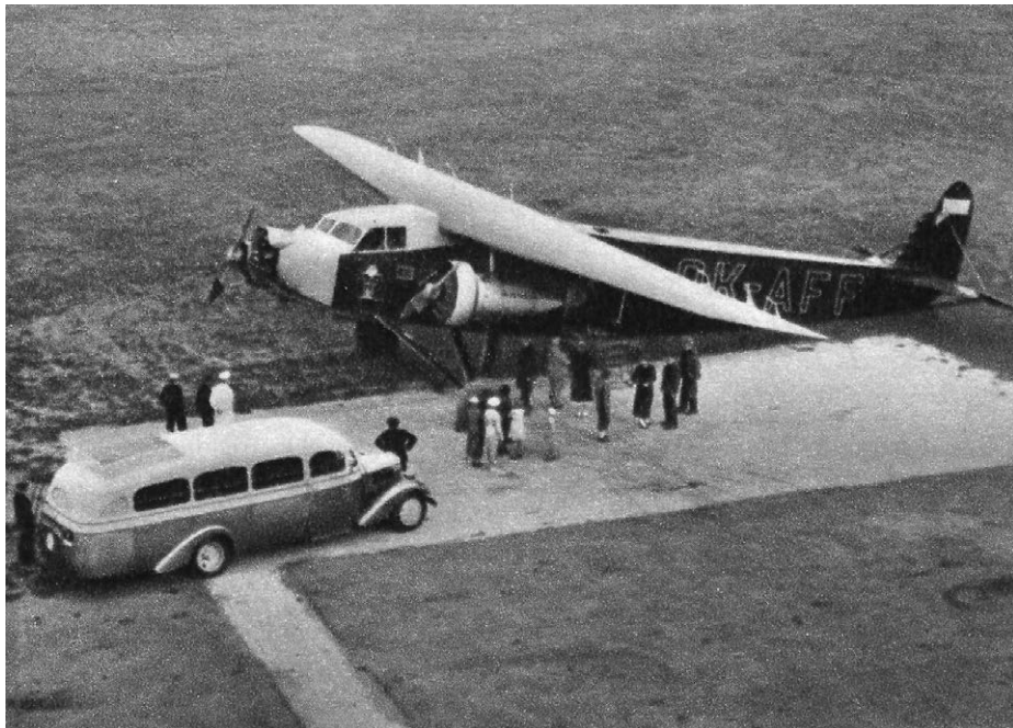
Obrázek 7: Nástup cestujících do letadla ČSA na Letišti Praha-Kbely v roce 1937 (před otevřením nového letiště v Praze-Ruzyni)

zřejmé, že v danou chvíli se bez státních subvencí neobejde žádný letecký podnik.