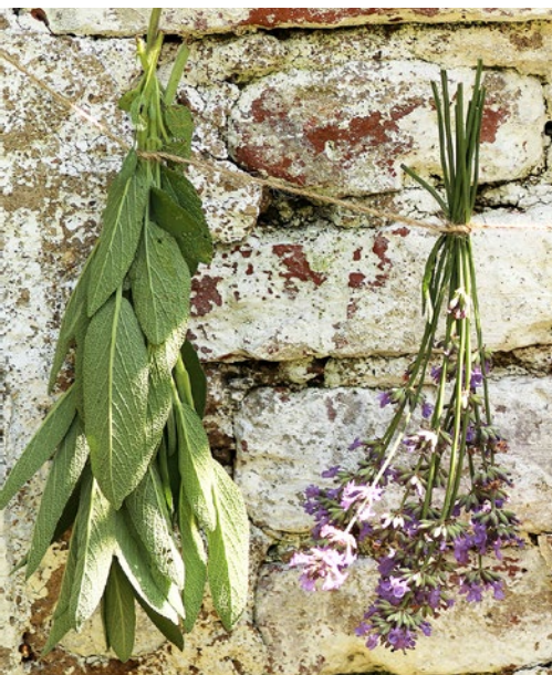
Nať lze sušit svázanou do malých kytiček.

Bylinky se suší na teplých, dobře větraných místech, nejlépe rozložené v tenké vrstvě na drátěném roštu či bílém papíru. Na roštích nezapomínejte bylinky obracet, aby se sušily rovnoměrně. Dávejte při tom pozor,