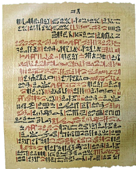
Ebersův papyrus vznikl před 3500 lety a obsahuje na 700 receptů a zaříkadel.

Doklady o použití bylin v této době k různým účelům nacházíme v podobě archeologických nálezů nástěnných i náhrobních maleb, fresek, maleb a rytin na keramice, basreliéfů i kamenných desek. Nejstarší důkazy o sběru a skladování bylin se nachází v jeskyních, které byly obývány před 60 000 lety. V jeskyních bylo nalezeno množství pylových zrn, které se tam nemohly dostat jinak než úmyslně, tedy sběrem a uskladněním. Naši předci postupně, metodou pokus–omyl získávali potřebné znalosti o působení jednotlivých bylin a jejich účincích. Tyto praktické znalosti a dovednosti si ústně předávali z generace na generaci.