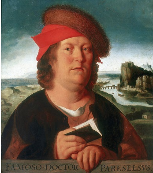
Doktor Paracelsus (1493–1541) působil po celé Evropě.