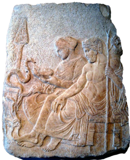
Reliéf zobrazující starořeckou bohyni zdraví Hygieiu a boha lékařství Asklépiea.