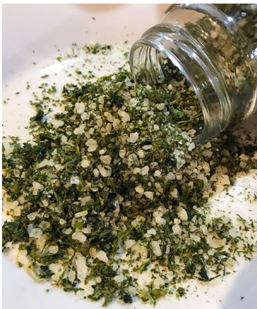
Česnekové listy lze sušit, ale i naložit do soli.