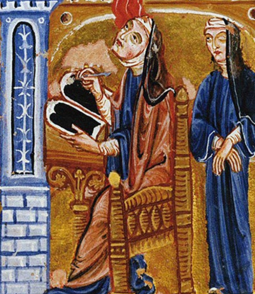
Hildegarda z Bingenu při tvorbě.