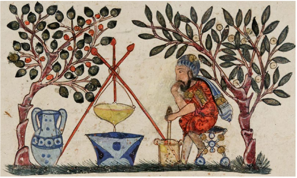
Lékař chystající elixír – vyobrazení z arabské verze starověkého Dioskuridova lékopisu, 1224.