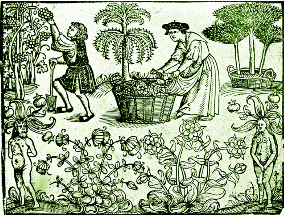
Dřevoryt z Grete Herball – prvního ilustrovaného herbáře v anglickém jazyce, který vyšel v roce 1526.

Za zlatý věk bylinkářství považujeme 16. až 17. století. V tomto období začalo vycházet mnoho klasických herbářů. Většinou šlo o soupisy léčivých rostlin včetně jejich botanického popisu, použití a dávkování.