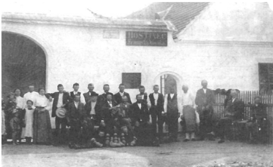
Hospoda v Malém Pěčíně před válkou

Další vlna mrazů přišla na začátku jara, kdy poškodila květy na stromech. Následovalo suché jaro a poté naopak deštivé léto. Výsledkem byla malá úroda obilí, přesto však byla kvalita zrna vysoká.