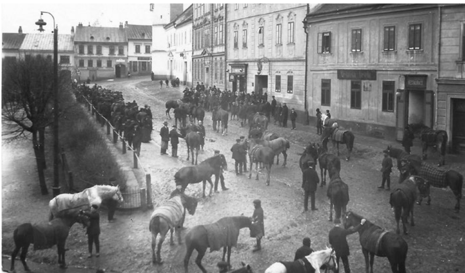
Rekvizice koní v Dačicích

Návrat by pro něj byl nebezpečný, proto se přesunul do Curychu a na půdě neutrálního státu zahájil zahraniční odbojovou činnost. Postupně se tato aktivita stále více točila kolem samostatnosti českých zemí. 51