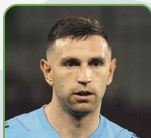
Emiliano Martínez ASTON VILLA