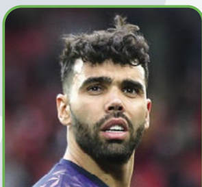
David Raya ARSENAL