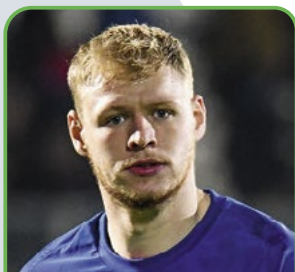
Aaron Ramsdale ARSENAL