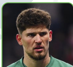
Gregor Kobel BORUSSIA DORTMUND