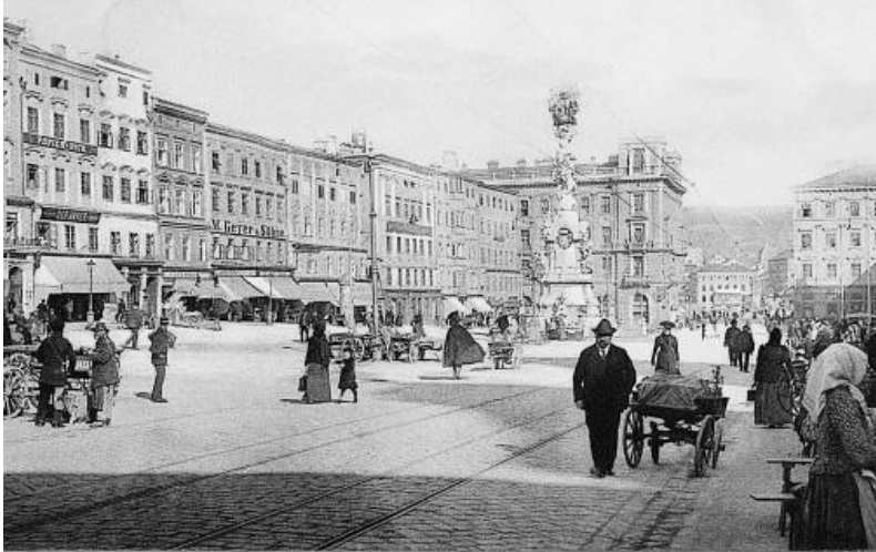
Linecké náměstí Františka Josefa kolem roku 1900 s trojičinným sloupem