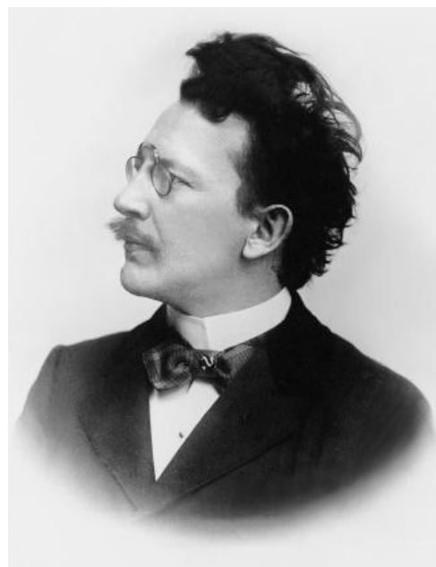
Německý radikální politik Karl Hermann Wolf

ale z politických důvodů musel studium přerušit. Roku 1890 založil ostře antisemitské noviny Ostdeutsche Rundschau (Východoněmecké rozhledy), od roku 1893 šířené v 5000 exemplářích jako deník po celé monarchii. Jejich název poukazuje na Rakousko jakožto „Východní marku“ Německé říše, tedy „Východní Německo“. Titul nedoplňoval obvyklý dvouhlavý orel Habsburků, ale jednohlavá německá říšská orlice, držící ve spárech svíjejícího se hada, jenž má představovat Židovstvo.