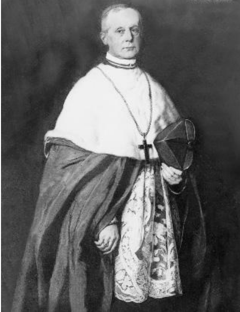
Kardinál Bedřich Schwarzenberg, pražský arcibiskup

Lednice - za nejkrásnější a největší moderní zámek habsburské monarchie.