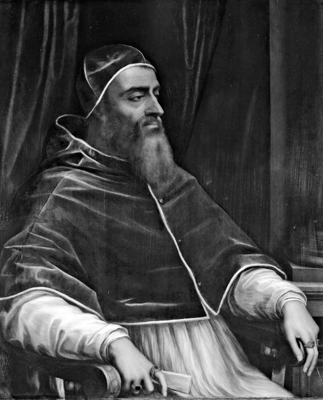
Papež Klement VII.