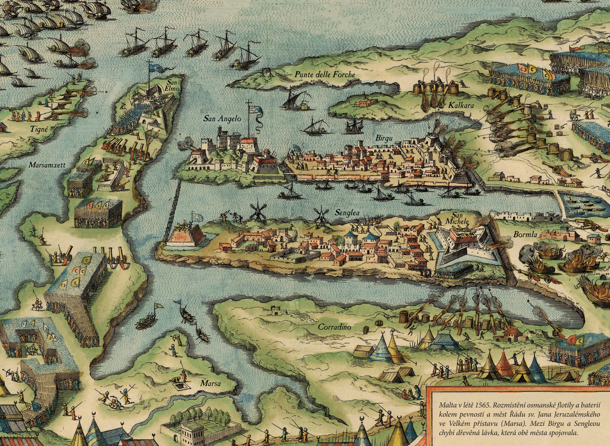
Malta v létě 1565. Rozmístění osmanské flotily a baterií kolem pevností a měst Řádu sv. Jana Jeruzalémského ve Velkém přístavu (Marsa). Mezi Birgu a Sengleou chybí dřevěná lávka, která obě města spojovala.