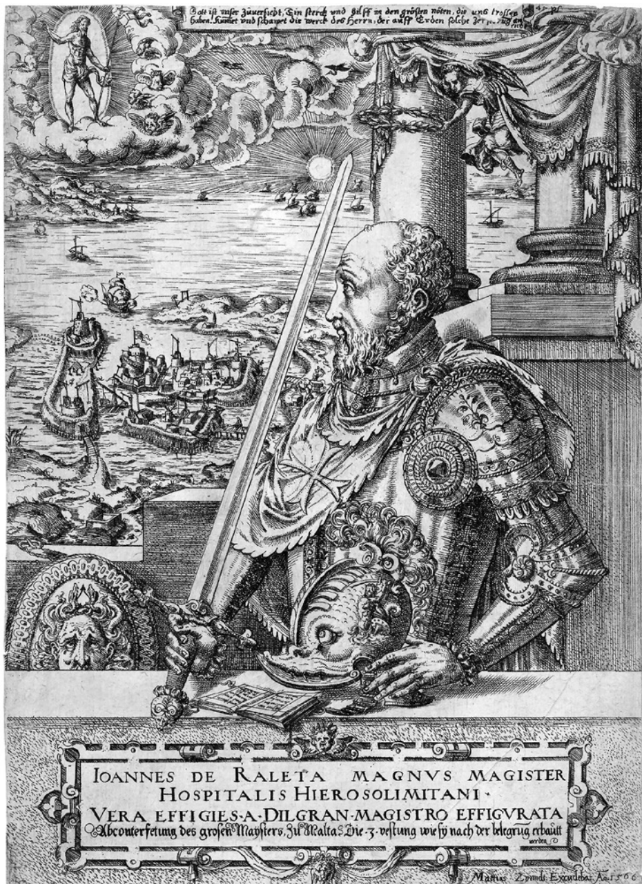
Jean de la Valette.