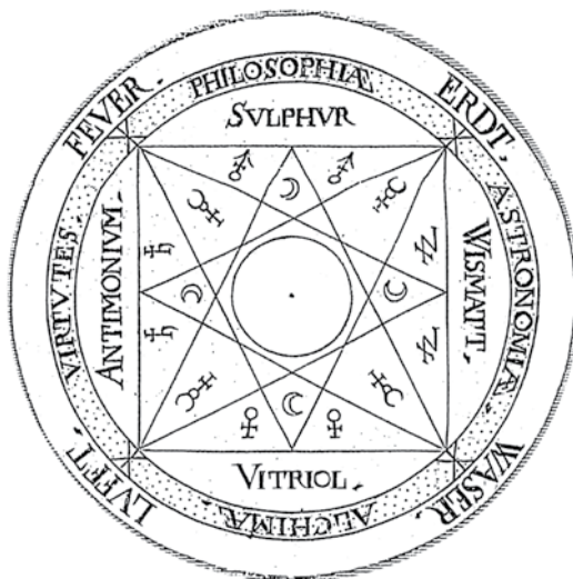
DIAGRAM HARMONICKÁ GEOMETRIE