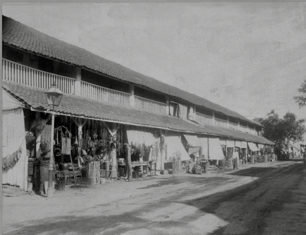
Ulice v Surabaji. Java.