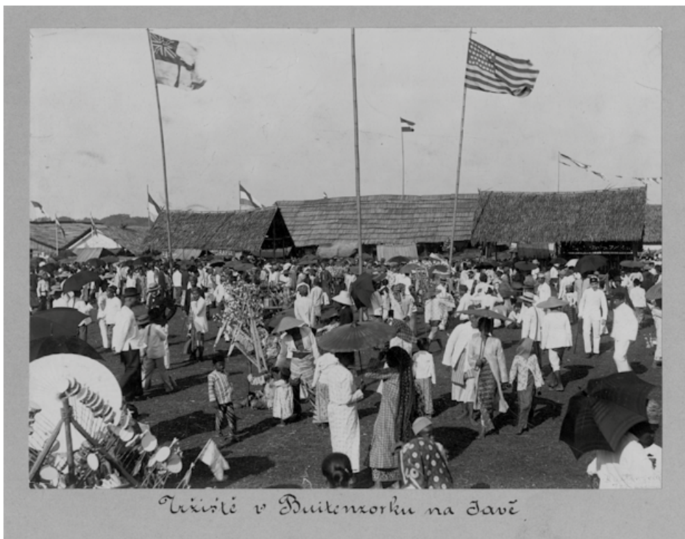
13. Tržiště. Indonésie, Jáva, Bogor (holand. Buitenzorg). Papír, albuminový pozitiv. 16,5 × 22 cm. Sbírka historických fotografií, inv. č. 193.297.

„keris“, krátká javánská dýka, třeba vzácná rodinná památka po některém proslaveném předkovi; objemnější, měkký balíček mohl obsahovati krásný batikovaný sarong a malý, těžký balíček hromádku zlata, šperky ženiny nebo matčiny. V dobách dobrých se ukládá do šperků. K takovému kousku zlata má domorodec více důvěry než k záložně „cizinců“. V dobách zlých putuje toto rodinné jmění do zastavárny. 243