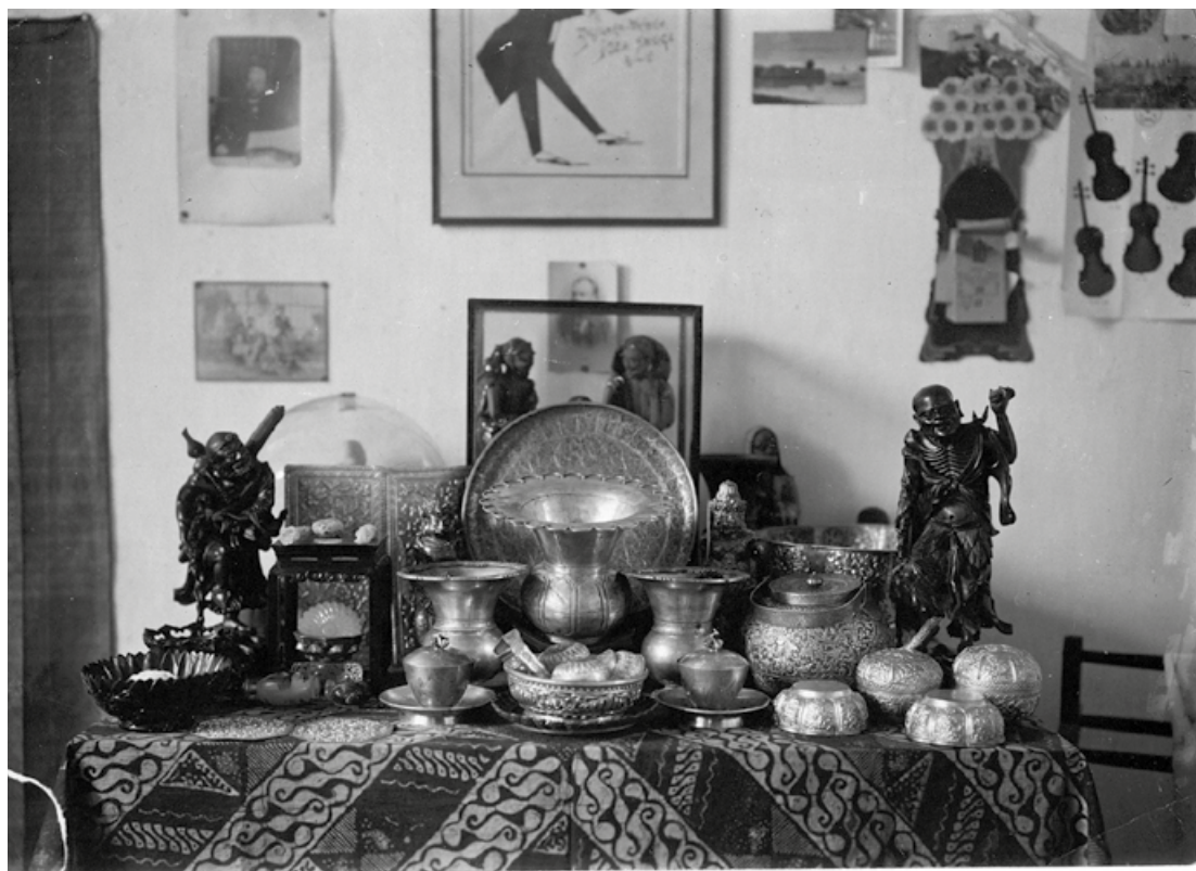
16. Fotografie předmětů, které Šrogl nashromáždil. Část jich přešla do sbírek Náprstkova muzea. NM – ANpM, ar. Šrogl.