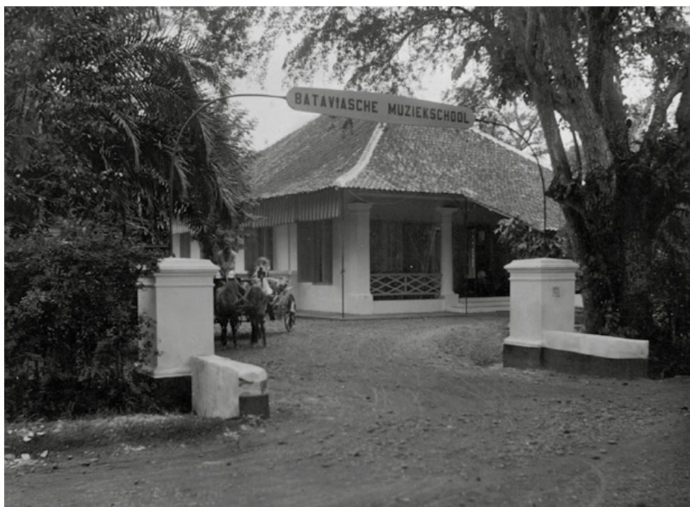
5. Batávská hudební škola, kterou Šrogl založil. Jáva, Batávie, počátek 20. století.