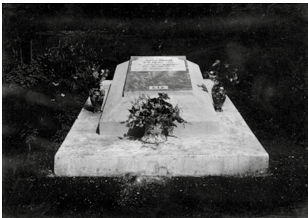
8. Náhrobek Jozy Šrogl v Batávii ve čtvrti Weltevreden. NM – ANpM, ar. Kořenský, 12/37/6.

Šrogl byl pohřben na křesťanském hřbitově ve Weltevredenu (obr. 9). 94