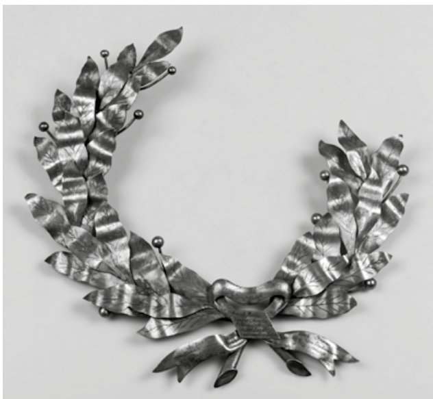
3. Vavříň, upomínka na koncert na rozloučenou. Rusko, Astrachaň, 13. 3. 1894, stříbro, tepané, ryté, v. 25, 5 cm, š. 26, 5 cm. Inv. č. A31580.