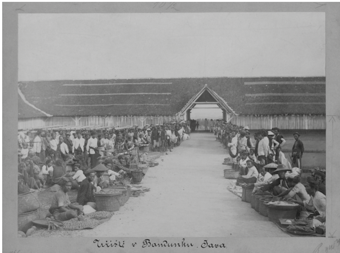
Tržiště v Bandungu . Java.