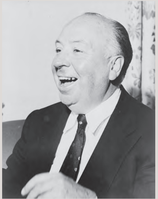
Henry Kissinger Ernest Hemingway Elon Musk Alfred Hitchcock