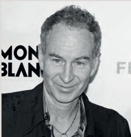
Hugh Laurie Suzanne Vega Kevin Spacey John McEnroe