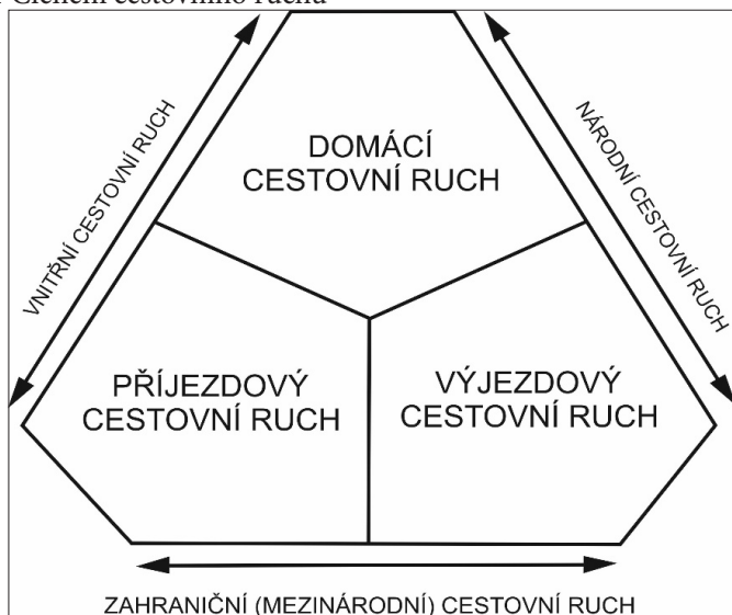
Obr. 1 Členění cestovního ruchu

Z členění uvedeného na obrázku 1 vyplývá další klasifikace cestovního ruchu, která zahrnuje národní cestovní ruch, vnitřní cestovní ruch a mezinárodní cestovní ruch: