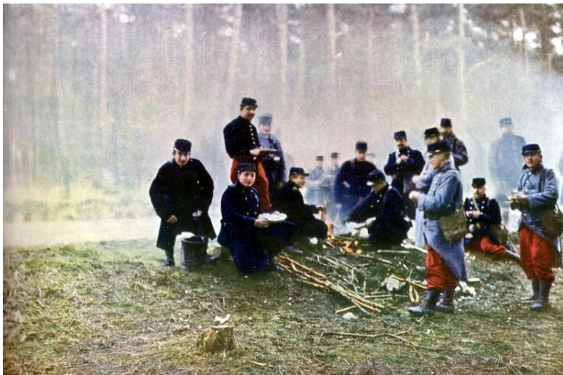
Vojáci Francie narukovali do války v zastaralých barevných uniformách