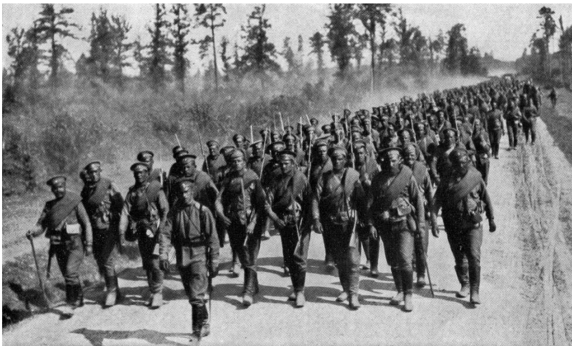
Ruská pěchota pochoduje na frontu