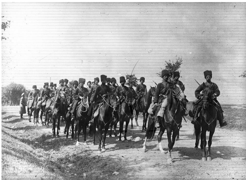
Kozácká jízda na začátku války