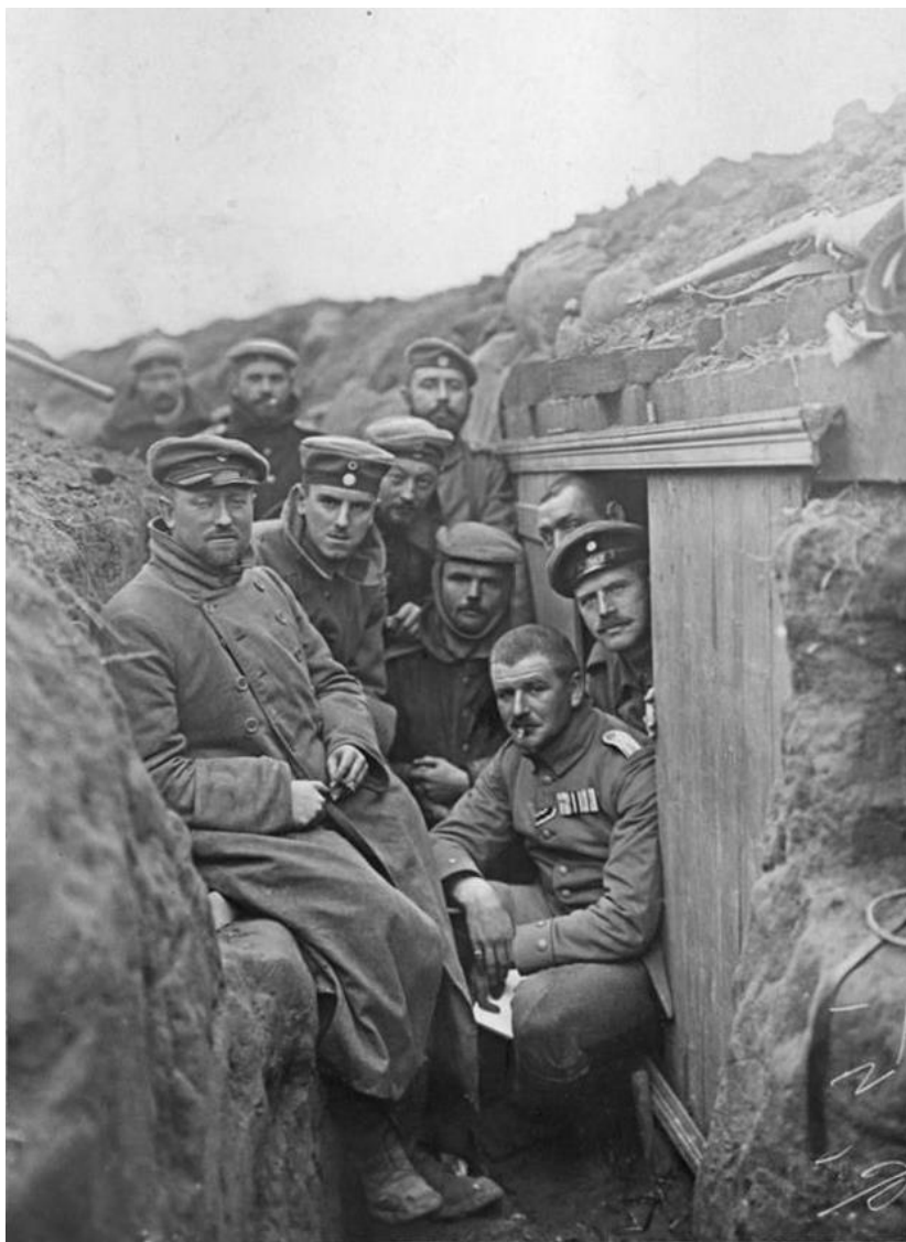
Němci pózuji v zákopech během bitvy u Yper