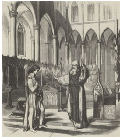
Opat Konrád z Erfurtu napomíná Václava III. u hrobu jeho otce, Česko-moravská kronika, 1862

„Byl však spatřen jakýsi rytíř, řečený Konrád z Botenštejna, rodem Durynk, jak vyskočil z paláce, drže v ruce zkrvavený nůž, a utíkal; a ti, kteří byli venku, ho chytili a jako vraha králova zabili, dříve než mohl promluvit nějakého slova. Zda byl on nebo jiný vinen, nevím, ví to Bůh, to však vím a je to známo celému světu, že záhuba onoho mladého krále způsobila vzrůst nesčíslných útrap,“ píše Petr Žitavský ve Zbraslavské kronice.