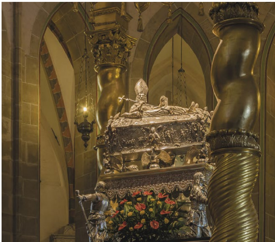
Vojtěchův náhrobek v polském Hnězdně

ostatků sv. Vojtěcha ještě s ostatky Vojtěchova nevlastního bratra, prvního hnězdenského arcibiskupa svatého Radima, ostatky pěti bratrů mučedníků a stovku vozů naplněných cennostmi, liturgickým vybavením a dokonce i zvony), ale Češi prý vzali z katedrály jen tu část ostatků sv. Vojtěcha, která byla zazděna za oltářem. „Relikvie uchovávané v samostatných relikviářích přežily,“ píše Misionář.