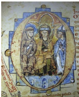
Svatý Prokop, svatý Václav a svatý Vojtěch v iniciále písmena O na iluminaci ze 13. století

Po otevření relikviáře byla uvnitř nalezena menší truhla z modřínového dřeva a v ní další, z 15. nebo 16. století, zabalená stuhami amarantové barvy s neporušenými pečetěmi arcibiskupa Floriana Stablewského