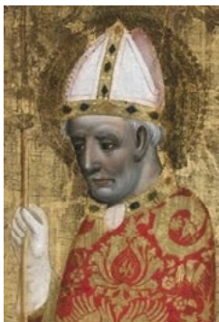
Detail z votivního obrazu Jana Očka z Vlašimi s vyobrazením svatého Vojtěcha

K tomuto cíli měla posloužit i Vojtěchova volba druhým pražským biskupem – předpokládalo se, že Slavníkovec Vojtěch se dostane coby druhý pražský biskup pod přemyslovský vliv, a pomůže tak tomuto rodu ote-