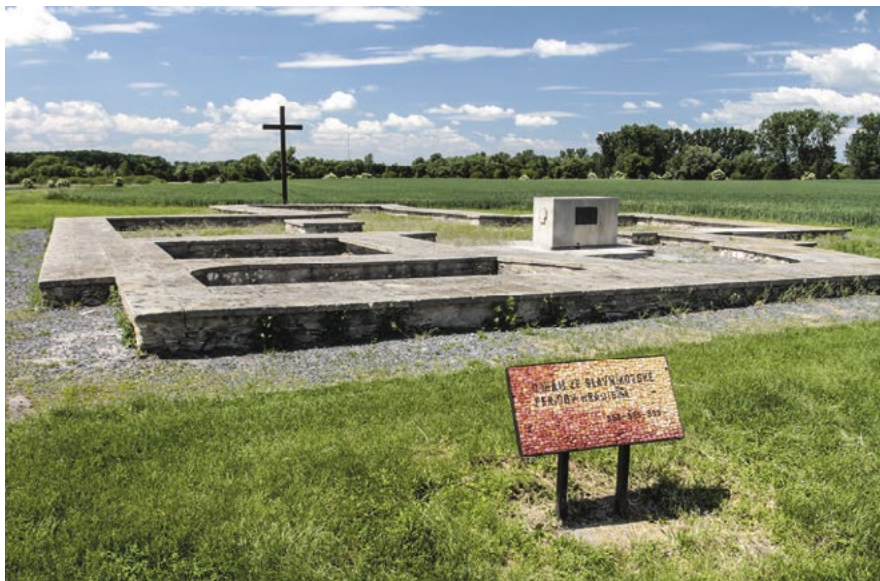
Slavníkovská Libice. Odkryté základy kostela v areálu hradiště z éry Slavníkovců v Libici nad Cidlinou

povraždila. Přežil jen Soběslav, jenž se v té době účastnil výpravy Otty III., a pak sám Vojtěch spolu se svým nevlastním bratrem Radimem, kteří už pobývali v Římě.