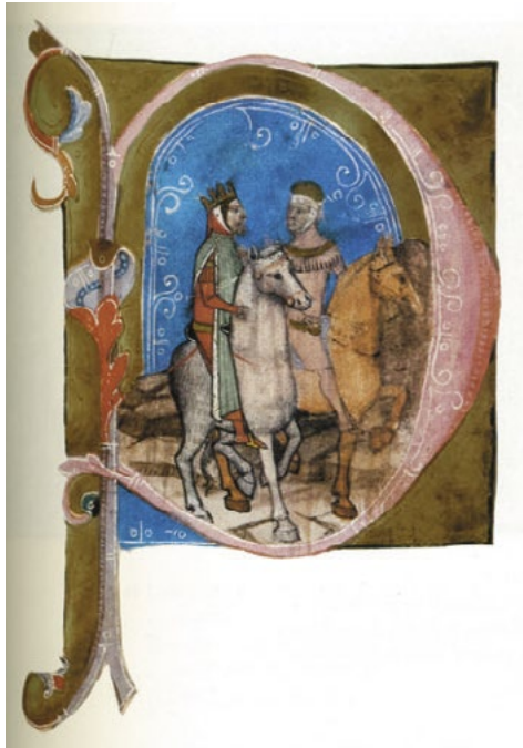
Návrat Václava III. z Uher do Čech, iluminace z Vídeňské obrázkové kroniky, uherské středověké kroniky s mnoha barevnými iluminacemi, uložené v maďarské Széchényiho národní knihovně v Budapešti

pocházela druhá česká královna Judita Durynská, manželka přemyslovského krále Vladislava II.). Příjmení zmíněného šlechtice je sice v kronikách různým způsobem komoleno, případně neuváděno, ve všech případech však jde pravděpodobně o tutéž osobu.