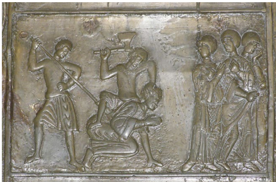
Plastické ztvárnění smrti sv. Vojtěcha na tzv. Hnězdenských dveřích, tedy dochovaných románských dveřích z doby kolem roku 1175, představujících významnou historickou památku jednoho z nejstarších polských měst Hnězdena. Plastika zachycuje Vojtěchovo probodnutí kopím a současně stínání sekerou

O hlavu český biskup skutečně přišel, je však otázka, zda k jejímu setnutí nedošlo až posmrtně. Skončila na kůlu, odkud ji údajně po třech dnech