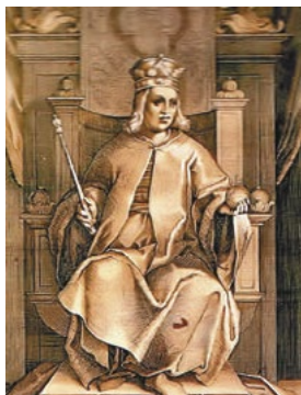
Václav III., král český, polský a uherský