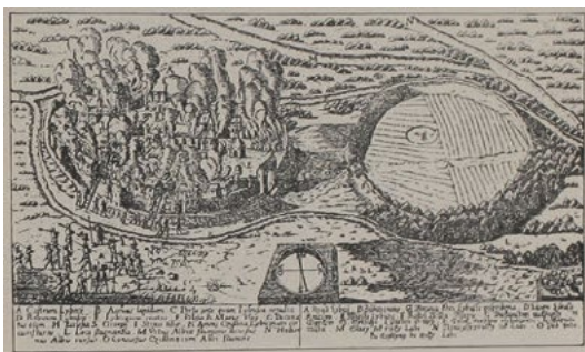
Dobývání Libice nad Cidlinou v roce 995, ilustrace z díla Rosa Bohemica sive vita S. Woytechi Matěje Benedikta Boletuckého z Hradiště z roku 1668

Vojtěch přejal většinu jejich myšlenek a snažil se je na půdě své dieceze prosazovat, což vyvolávalo na jedné straně opětovný růst napětí mezi přemyslovským a slavníkovským rodem, na druhé i odpor značné části těch obyvatel země, kteří ve svém životě stále dávali přednost pohanským způsobům. Proti Vojtěchovým snahám o reformy se stavěla dokonce i část duchovenstva a samozřejmě také přemyslovský panovník, jímž byl v té době už Boleslav II. řečený Pobožný.