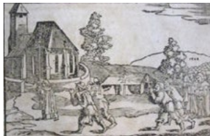
Pohřeb Václava II., Hájkova kronika

Kdo potom spáchal atentát na mladičkého Přemyslovce? Vyloučit se nedá ani to, že vrahů bylo víc. „Vraždu provázel hluk a křik, který konečně