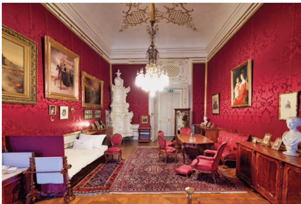
Ložnici Františka Josefa v Hofburgu zdobí obraz Sisi na koni.

fotografie mocnářova apartmánu. Poté dílo zdědila nejmladší dcera císařského páru Marie Valerie a v majetku jejich potomků se portrét nacházel po mnoho desetiletí, než byl prodán. Jména dalších majitelů zůstala v anonymitě. Velký rozruch ale vzbudila aukce pořádaná vídeňskou aukční síní Dorotheum 27. dubna 2017: na ní byl tento obraz telefonicky vydražen za neuvěřitelnou částku 1 540 000 € a přešel do vlastnictví jistého rakouského sběratele. V císařských apartmánech v Hofburgu visí kopie tohoto plátna. Fotografie originálu obrazu najdou čtenářky a čtenáři na obálce této knihy.