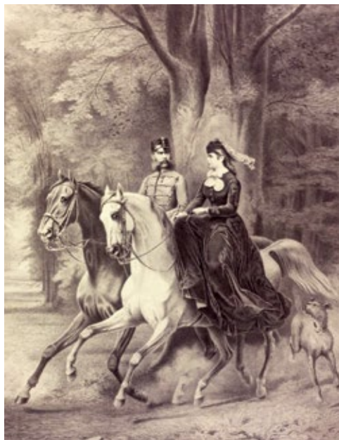
Jízda na koni byla velkou zálibou císařského páru.

V mládí i ve zralejším věku mívala Sisi ve zvyku osedlat koně a vyjet si v časných ranních hodinách. Dobový záznam ve vídeňské dvorní kronice dokonce těmto vyjíždkám přiřítal zázračné účinky na svěžest pleti: „Stejně jako Diana de Poitiers vdělila císařovna Alžběta za svou krásu zřejmě vyjíždkám před rozedněním, kdy jí ranní rosa ozdobila pleť.“ 410 Diana de Poitiers žila v renesanční Francii a byla nejprve vychovatelkou a posléze, když dospěl, milenkou krále Jindřicha II., muže o celých dvacet let mladšího než ona. Vyznačovala se inteligencí, měla dokonalou postavu, pleť a krásně tvarované poprsí. Zamilovaný panovník ji zahrnoval dary. Věnoval jí mimo jiné vodní zámek Chenonceau, jehož jedna část byla vystavěna na mostě nad řekou Loire. Sídlo představuje po Versailles druhý nejnavštěvovanější zámek Francie. Svou krásu si Diana uchovala do pozdního věku, a to nejen díky svému aktivnímu životnímu stylu, ale také vlivem kráslicích prostředků. Ty však obsahovaly rtuť a užívání těchto zdraví škodlivých preparátů zkrátilo Dianě život i přes její neutuchající vitalitu: skonal ve věku šestašedesáti let na svém milovaném rodovém sídle Anet (za sedm let tak následovala svého královského milence, který zahynul na následky strašlivého