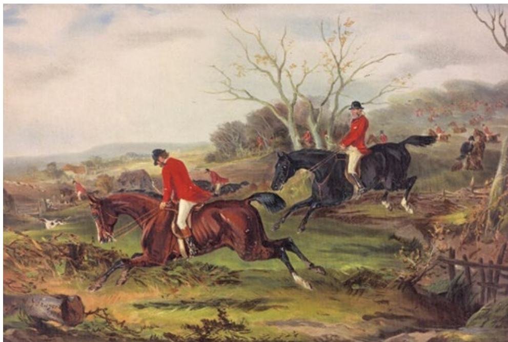
Lovci v červeno-bílých jezdeckých kostýmech.

Sisi se nadchla nejen pro cirkusové umění, ale také pro parforsní hony (termín pochází z francouzského par force de chiens – silou psů, za pomoci psů). Jednalo se o předem pečlivě připravené štvance. Šlechta na koních