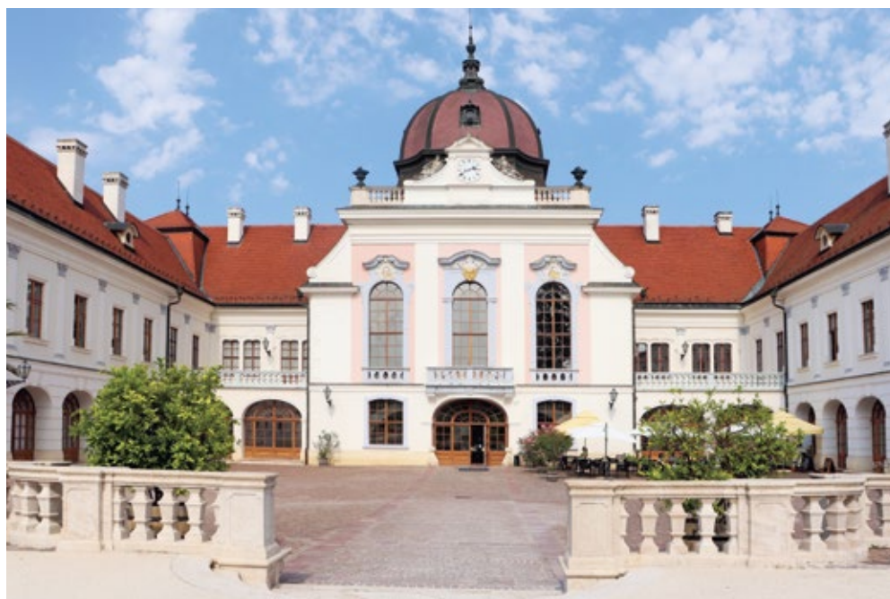
Gödöllő, Alžbětino milované sídlo.

Ve vztahu ke koním disponovala Alžběta údajně zvláštní mocí. Uměla zhypnotizovat a zkrotit i ta nejdivočejší zvířata. „Má schopnost získat [...] bezprostřední a téměř živočišný kontakt s koněm,“ prohlásil o ní Franz Gebhardt, přední jezdec španělské školy lipicánů ve Vídni. 12 Hrabě Festetics, jeden z bohatých uherských magnátů, měl ve stáji hřebce jménem Černý ďábel. Všichni se ho báli a nikdo se k němu neodvážil přiblížit. Hrozilo, že bude muset být utracen. Když se o něm dozvěděla císařovna, nemohla odolat výzvě zvíře zkrotit. A to se jí také podařilo. Majitel jí koně poté daroval. O nadpřirozené schopnosti císařovny ovládat zvířecí duši byl přesvědčen i její oblíbený britský jezdecký společník William „Bay“ Middleton. Je málo známou skutečností, že osoby, které trpí strachem z lidí hraničícím až s idiosynkrazií, jímž strádala i Alžběta, obvykle disponují mimořádnou psychickou silou ve vztahu ke zvířatům. Umějí se ponořit do tajů jejich duše a komunikovat s nimi. Tato schopnost rezonovat s psychikou zvířat je dána některým senzitivním lidem; Sisi ji rozhodně měla. Zvířata, a koně zcela bezpochyby, zase mívají vysoce vyvinuté instinkty,