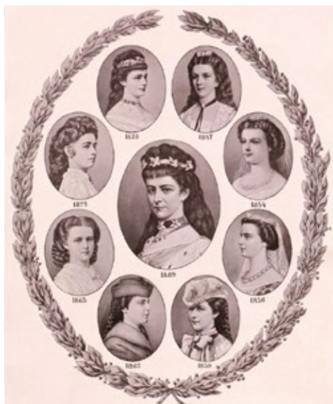
Jak šel čas s císařovnou Sisi.