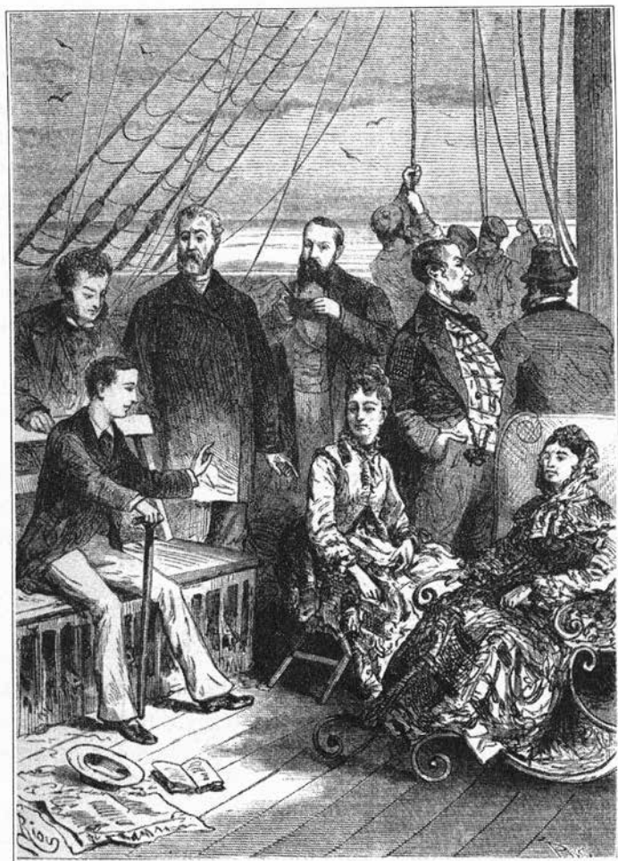
Cestující na Chancelloru.